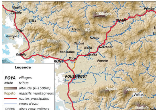
CARTE 1. – Wēté, localisation et carte d'ensemble (dessinée par Grégoire Blanchard, Institut agronomique néocalédonien, 2018)

L'expression āji nāpō ne représente pas seulement une « méprise historiographique » ; elle met en évidence le rôle et l'importance que ce lieu occupe dans l'imaginaire actuel des habitants, notamment des jeunes. Āji ne coïncide pas forcément avec