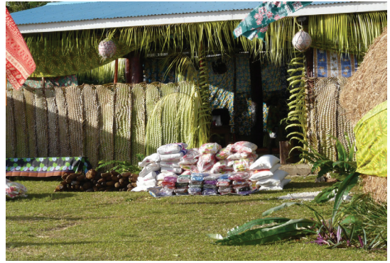
PHOTO 2. – Tro (coutume de mariage) de la chefferie de Gaïca, Hnathalo, novembre 2007

Il faut rappeler que le drehu oppose la notion de ka xep qa hnagejē (litt. « qui/débarquer/venant de/mer ») « qui vient de la mer » pour signifier tout ce qui vient de l'extérieur (personnes, biens, plantes, nourriture) et qui a souvent une connotation négative, à celle de tout ce qui a trait à la terre à travers