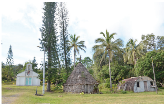
PHOTO 1. – Ancienne case, église et hangar américain à Wété, juin 2015

De la RT 1, la principale route qui relie Nouméa au nord du pays en passant par la côte ouest, les indications pour Wété (ou Ouaté dans la transcription française) 8 ne sont guère lisibles, cachées par les nombreux panneaux qui signalent la mine du Kopèto, quelques kilomètres plus loin. En quittant la route principale et en suivant les lacets qui s'enchaînent sur quelques kilomètres, on n'aperçoit que les profils terreux de montagnes rougeâtres corrodées par les mines et de monstrueuses structures rouillées, vestiges des anciens engins miniers désormais abandonnés. Soudain, après quelques virages, le paysage change radicalement. Les étendues arides laissent place à une vallée verdoyante couverte de champs de taros et d'ignames, baignée par la rivière