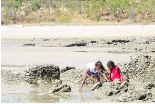
FIGURE 4. – Une enfant plus âgée montre à sa jeune sœur comment collecter les huîtres de roche, péninsule Dampier, 28/07/2017

Lors de nos séjours sur le terrain, il nous fut possible de constater que la participation à ces activités représentait effectivement une occasion supplémentaire, pour les enfants de ces hommes, d'observer et de reproduire les gestes opérés par leur père à la pêche. Lorsqu'ils ne sont pas à l'école, ces enfants et ces jeunes adolescents assistent leur père ou leur oncle dans la collecte de bois pour la confection des lances pour la pêche, ou la préparation du feu, et l'écoutent s'adresser aux touristes. Les plus grands partent pêcher de leur côté pour ajouter leurs propres prises à celles du groupe et assurer ainsi une quantité suffisante de poissons pour la dégustation offerte aux touristes. Régulièrement, leur père ou leur oncle s'adresse aussi à eux pour leur poser une question et en profiter pour tester leurs connaissances sur telle ou telle espèce.