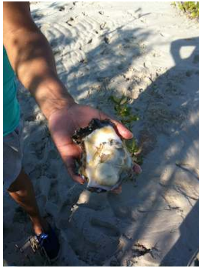
FIGURE 2. – Collecte d'huîtres ( Saccostrea cucullata ), péninsule Dampier, 19/08/2013