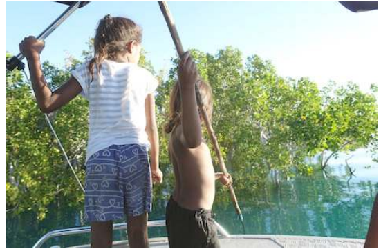
FIGURE 5. – Une enfant de dix ans supervise sa jeune sœur dans son apprentissage de la pêche à la lance, péninsule Dampier, 28/07/2017

souvenir, de reproduire et de réactiver le pouvoir de ces lieux et la présence des ancêtres.