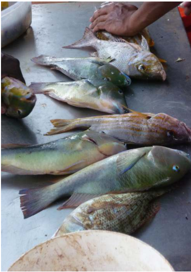
FIGURE 1. – Retour de pêche : jooloo ( Lutjanus carponotatus ) et goolan ( Choerodon albigena ) péninsule Dampier, 03/08/2011