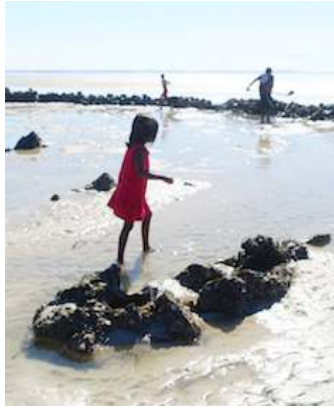
FIGURE 3. – Enfant de cinq ans se livrant à la collecte de mollusques et des coquillages en marge de l'activité des adultes, péninsule Dampier, 28/07/2017

« technology has changed while the pattern of exploitation of marine resources has not. » (Smith, 1984 : 444)