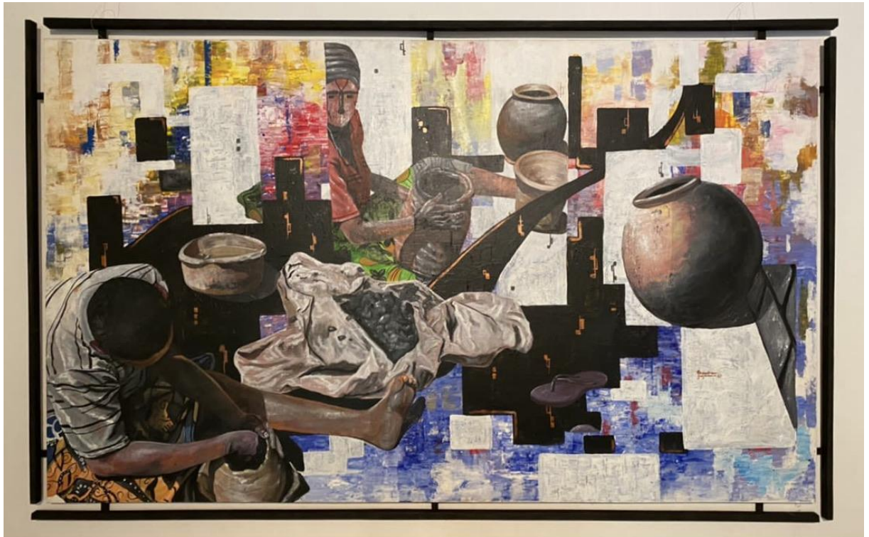
Autour du pot 1 , Christian Bujiriri, 2021, 120x200cm.

Esquisses | Les Afriques dans le monde, 2022