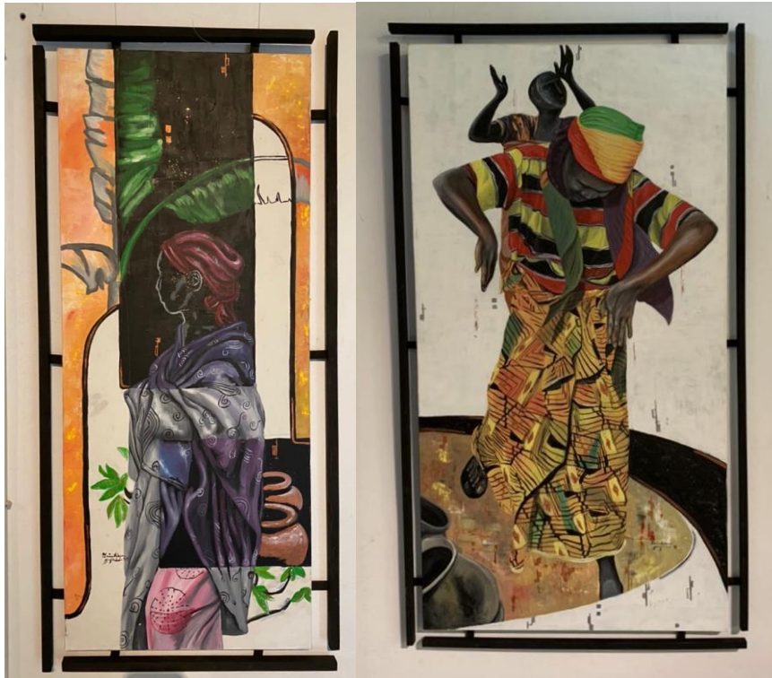
Autour du pot 5 , Christian Bujiriri, 2020, 120x50cm (gauche)

Esquisses | Les Afriques dans le monde, 2022