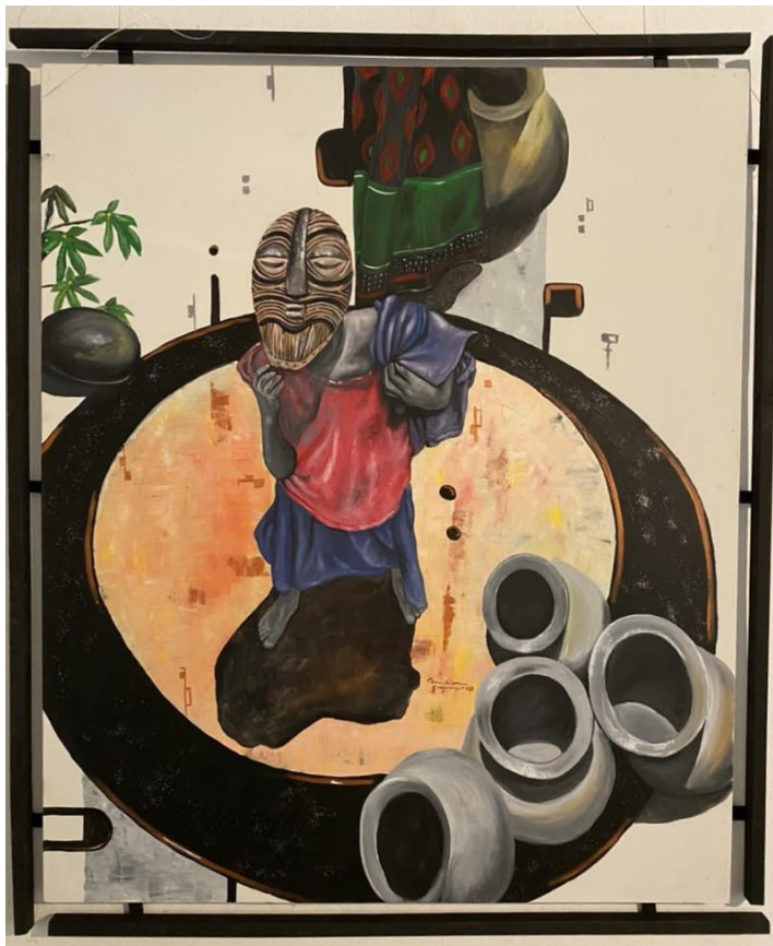
Autour du pot 2 , Christian Bujiriri, 2021, 120cmx100cm