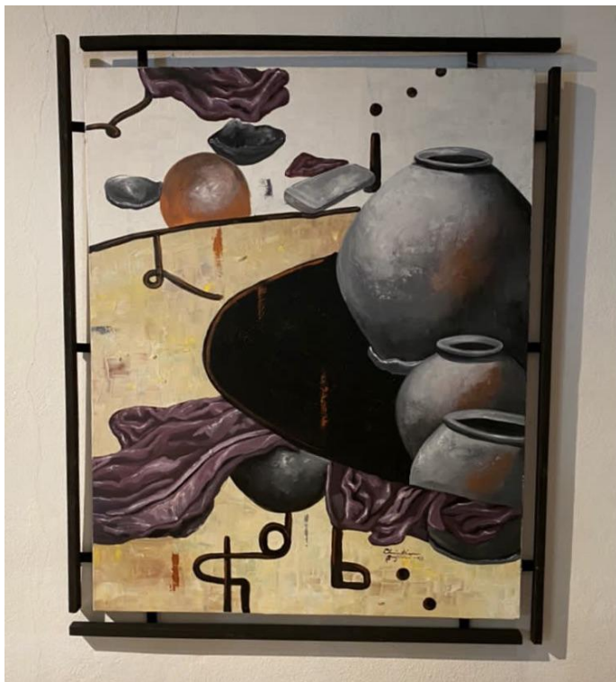
Étude d'un atelier de poterie 1, Christian Bujiriri, 2020, 90x40cm