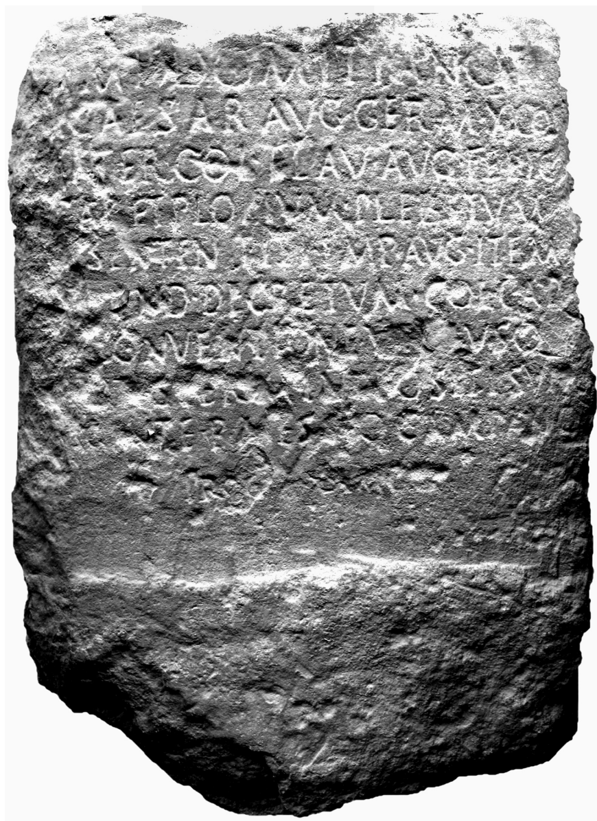
Fig. 1 – Terminus di confine tra le proprietà di Capua e quelle di Plotius Plebeius nell'isola di Creta.