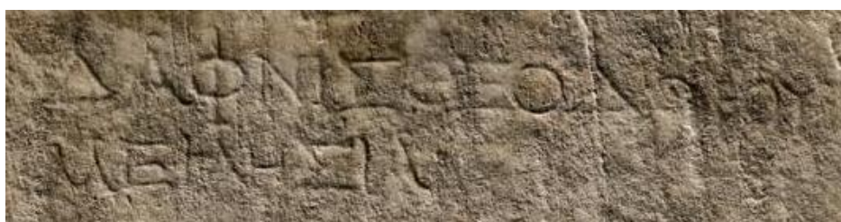
ΔΑΦΝΙΣ ΘΕΟΔΟΡΟΥ / ΜΕΙΛΗΣΙΑ Dafnis, (hija) de Teodoro, milesia (original de Mileto).