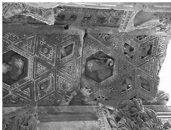
FIG. 5. Templo del peristilo del templo de Baco con "tyches".

ser una decisión conjunta, basándose en la idea de intentar fomentar un santuario de importancia a nivel provincial emplazado en una importante ciudad romana. La teoría de Seyrig es quizás la propuesta más plausible ya que como hemos visto, la colonia de Heliopolis, a parte de su importancia, estaba bien comunicada con otros núcleos clave de la provincia tanto a nivel urbano (Beirut, Damasco, Nemesa) como religiosos (Monte Hermón). Así, el carácter sincrético de estos templos serviría de manera política para aunar en un espacio religioso de una larguísima trayectoria previa, a cultos prerromanos con una asimilación romana. Y tal espacio sincrético se plasmaría sin duda en su aspecto arquitectónico.