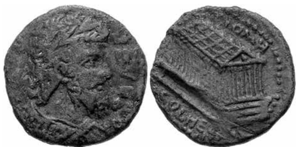
FIG. 3. Templo de Júpiter Heliopolitano en el reverso de una moneda de Septimio Severo.

El templo de Júpiter se data con unidad entre los investigadores a través de una inscripción que indica que se encontraba aún sin terminar en el año 60 d. C., 8 pero como es normal, todo indica a que pudo haberse iniciado su construcción casi a principios de siglo. Quedan muy pocos restos debido a que en época musulmana sirvió como base para asentar una fortificación, 9 pero los que han perdurado muestran algunas tendencias muy significativamente orientales, como el tamaño colosal del templo (48 x 88 m) catalogado seguramente como el más grande de todo el mundo romano. Otra fuente interesante es la numismática que nos lega una perspectiva en escorzo de gran detallismo, en monedas de Septimio Severo, Caracalla, Geta, Octacila Severa o Filipo el Árabe.