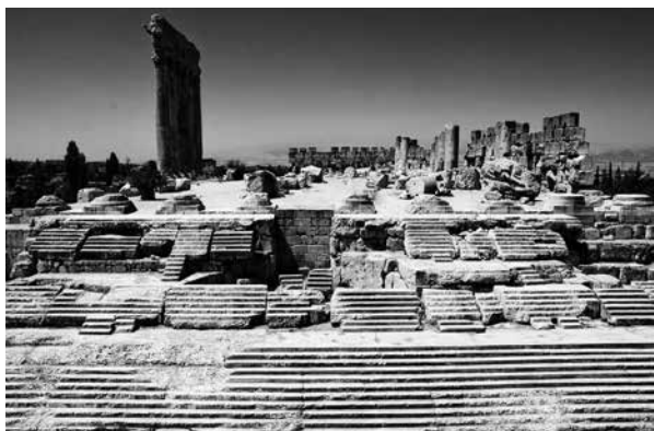
FIG. 2. Escalinata y restos del templo de Júpiter Heliopolitano (Baalbek)

El templo de Júpiter se data con unidad entre los investigadores a través de una inscripción que indica que se encontraba aún sin terminar en el año 60 d. C., 8 pero como es normal, todo indica a que pudo haberse iniciado su construcción casi a principios de siglo. Quedan muy pocos restos debido a que en época musulmana sirvió como base para asentar una fortificación, 9 pero los que han perdurado muestran algunas tendencias muy significativamente orientales, como el tamaño colosal del templo (48 x 88 m) catalogado seguramente como el más grande de todo el mundo romano. Otra fuente interesante es la numismática que nos lega una perspectiva en escorzo de gran detallismo, en monedas de Septimio Severo, Caracalla, Geta, Octacila Severa o Filipo el Árabe.