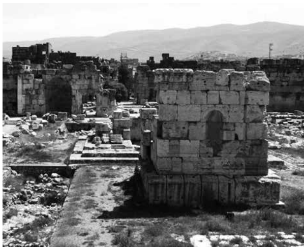
FIG. 6. Los dos altares turriformes frente al templo de Júpiter Heliopolitano.

tienen hélices entrelazadas, un hecho que es poco frecuente, a excepción del templo de Cástor y Pólux en la propia Roma, lo que llevó a Ward-Perkins, a apuntar que esto era un reflejo de la influencia de los estilos de la capital en el diseño arquitectónico y decorativo de Baalbek. 17 Ahora se conocen otros tipos de capiteles con estas hélices, como el que se encuentra en el museo de Alejandría o uno inacabado en Palmira, lo que postuló el posible origen de esta forma en Oriente. 18