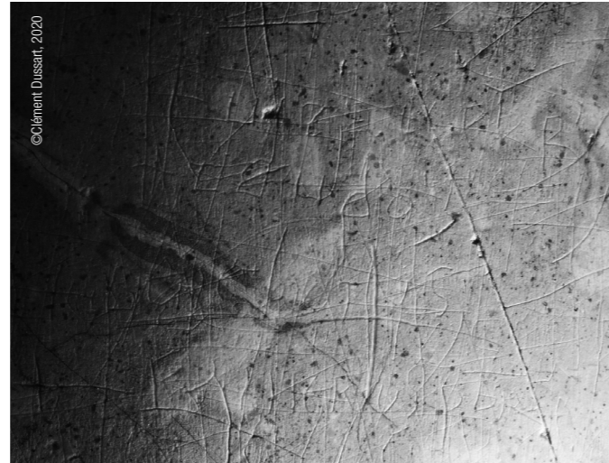
Bethléem, basilique de la Nativité : graffiti de clercs précédés d'une croix (IX e siècle)

Ces graffiti , malgré l'aura qu'aurait pu leur valoir leur antiquité, ont souvent été méconnus et assimilés à du vandalisme ; on a encore écrit très récemment que les gardiens des lieux saints à l'époque médiévale luttèrent contre ce fléau. La réalité était bien différente, du moins pour cette période. L'idée d'un graffito illicite est le fruit d'une trop grande foi dans le témoignage de l'Evagatorium . Contrairement aux auteurs des autres récits contemporains, Félix Fabri, dominicain à l'origine de ce récit de voyage en Terre sainte à la fin du XV e siècle, transcrit les règles énoncées par les franciscains aux pèlerins dès leur arrivée en insistant sur la défense faite à tous de réaliser ce que nous appelons des graffiti . Cette interdiction, qui n'apparaît dans aucun autre témoignage, pourrait être la simple expression de sa vision des choses, comme en témoigne sa longue