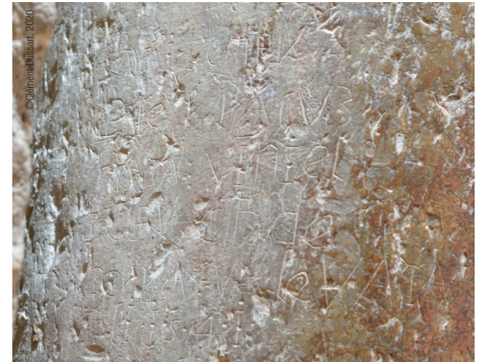
Bethléem, cloître de la basilique de la Nativité : graffiti en mémoire d'une femme pèlerin (1541)

L'analyse de ces vestiges matériels conjuguée à une meilleure connaissance des usages de cette époque et des différentes manifestations de la piété des pèlerins devrait permettre de mieux comprendre et définir ces traces que nous appelons par commodité des graffiti .