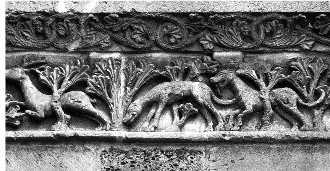
Henri de Ferrières Livre du roi Modus et de la reine Ratio fin XIVe siècle BnF département des Manuscrits Français 12399 fol. 44v

Avant de l'utiliser, il faut néanmoins le récupérer. Comme dit précédemment, le bois animal est caduc, et son approvisionnement diverge de l'os dans ce sens. En effet, les populations peuvent le récolter soit par la chasse – il est appelé bois de massacre –, soit par le ramassage – il est alors appelé bois de mue. Pour les périodes médiévales, la faible proportion d'espèces sauvages par rapport aux espèces domestiques