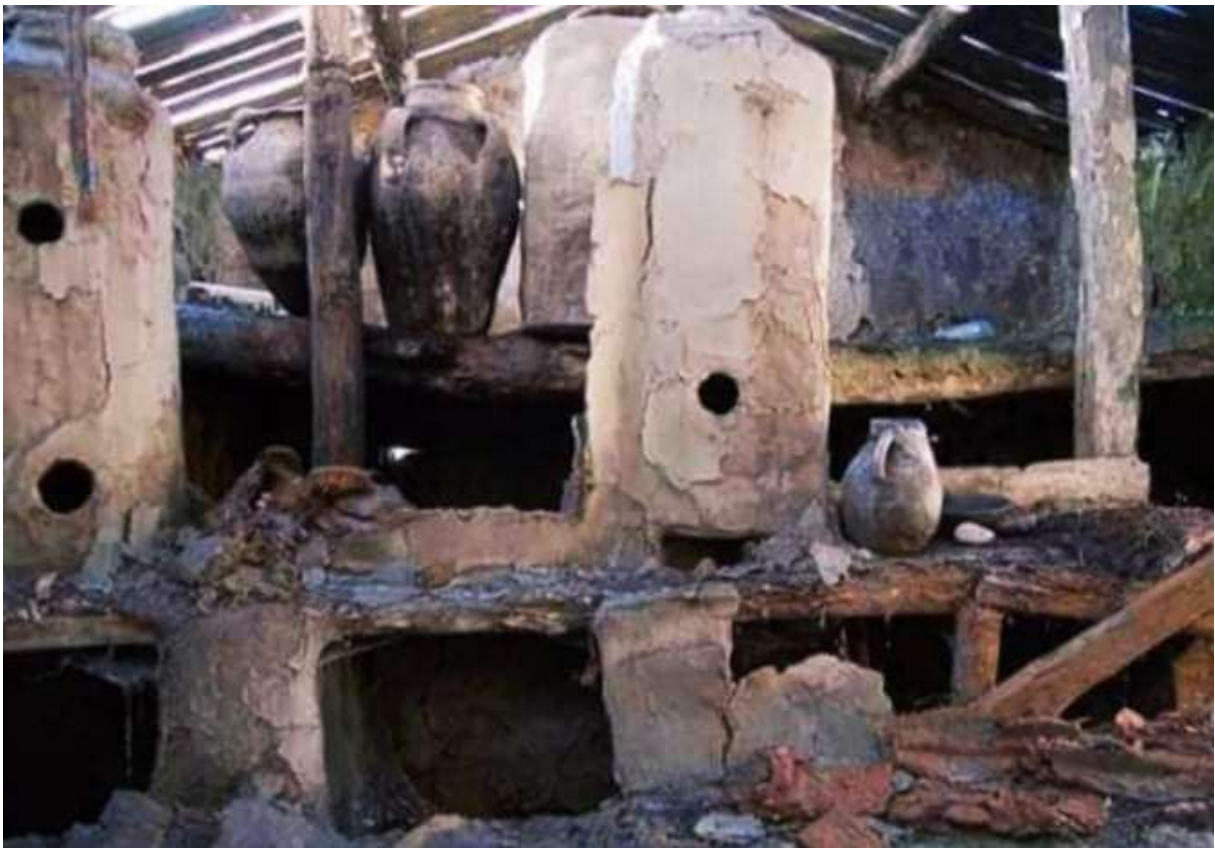
Maison sans toit

Ceci dit, il est vrai qu'une partie du monde rural a connu de nombreuses destructions et les maisons en premier, parce qu'elles servaient à nourrir les « rebelles ». Cependant, comme dans toute guerre, on ne peut pas avancer que l'armée a rasé systématiquement les campagnes et que la guerre (et les regroupements) a démarré en même temps et avec la même intensité partout. Il y a eu environ 20 % de la population déplacée, c'est considérable, il en restait 80 % à échapper à ce véritable cataclysme.