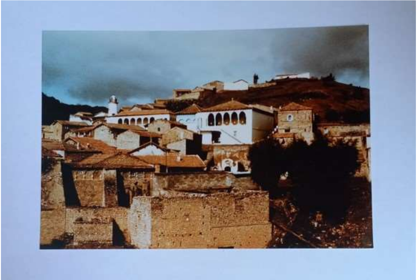
At Sidi Braham, 1986

Encore plus étonnant pour l'époque, Bourdieu ne s'est pas limité à la seule Kabylie, il a enquêté dans l'Aurès (autre région berbérophone qui privilégie les constructions en terrasses) et dans le M'Zab 13 , dans le Sud, espace urbain très différent des deux autres au niveau de l'architecture et de l'organisation sociale.