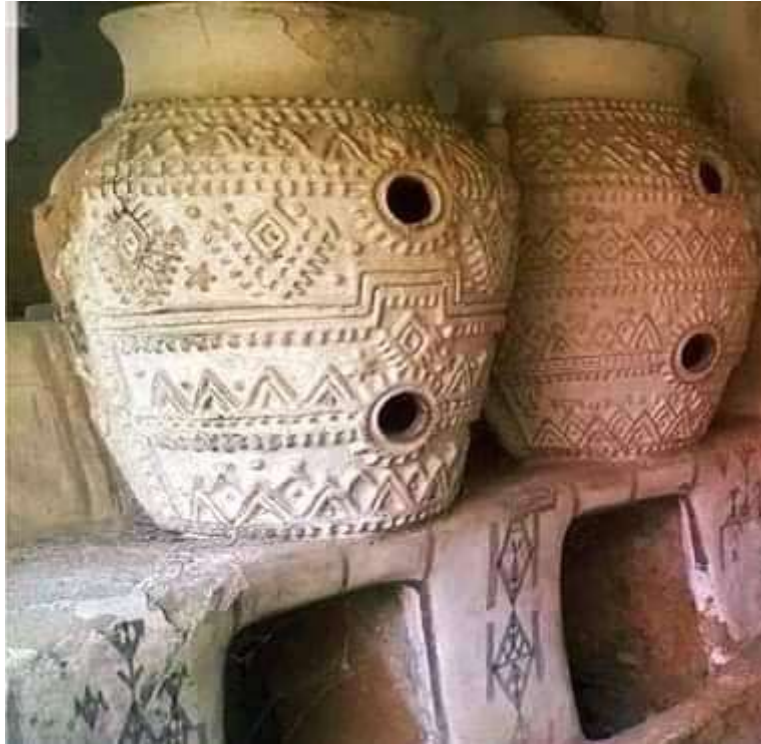
Intérieur de maisons kabyles

convaincu de la nécessité de travailler sur les rites ( Le Sens pratique , introduction, p.10) qui risquaient de disparaître à jamais des mémoires 5 .