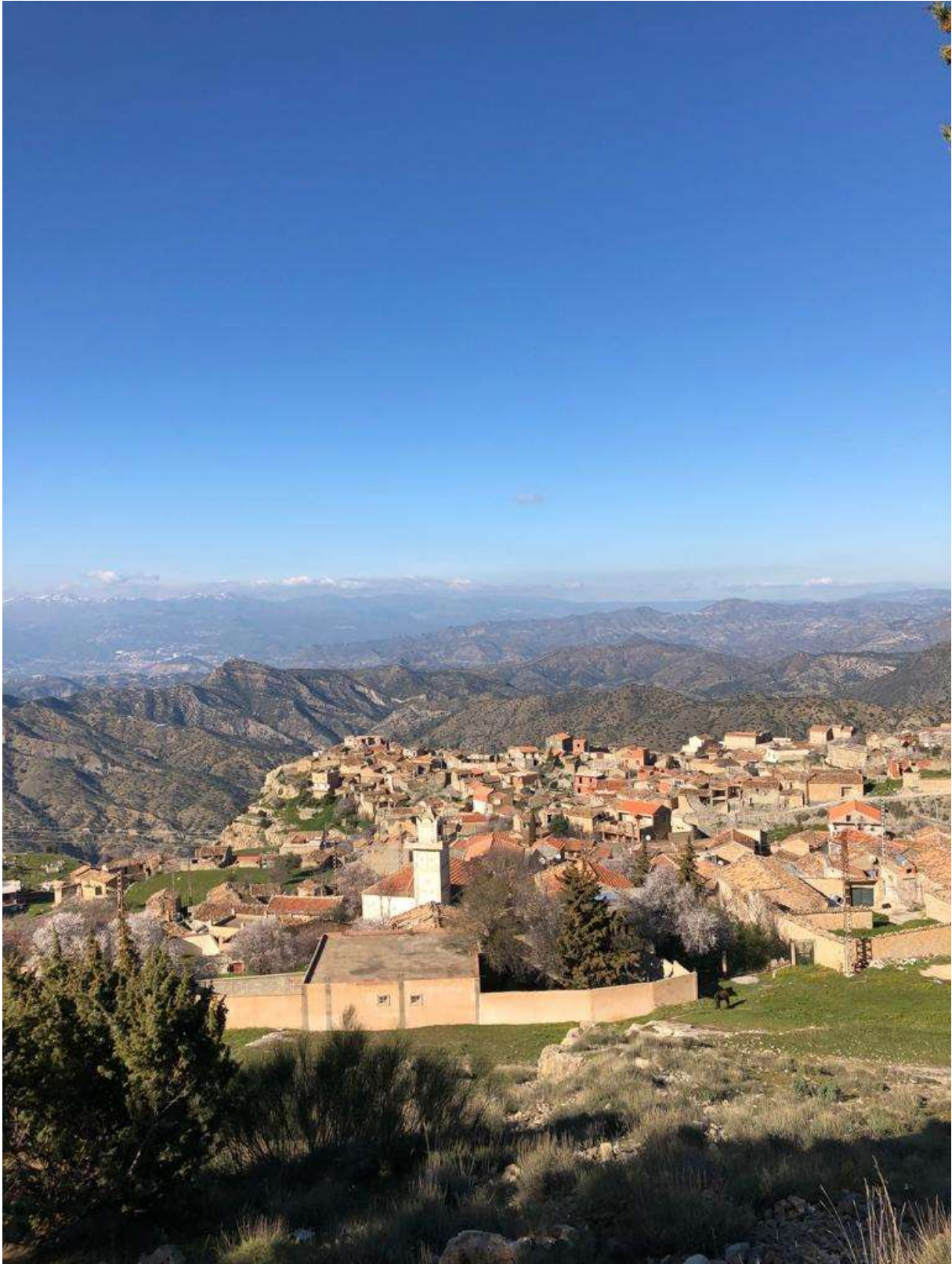
Kelaâ n At Abbès, février 2019