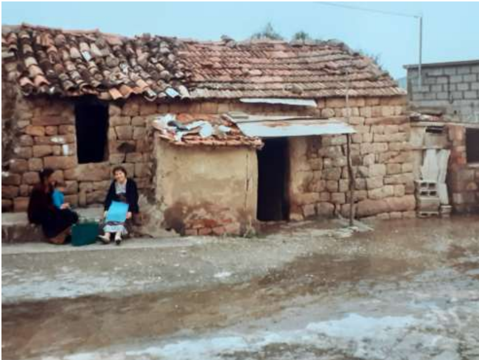
Maison en 2012, hameau Abla, Tizirt sur Mer, (photo Tassadit Yacine)

1992 avec les généalogies établies par Bourdieu (en 1960) pour vérifier les familles qui sont restées et celles qui sont parties, des familles qui ont conservé leurs maisons et celles qui les ont détruites ou restaurées, modernisées. À partir de cette première enquête en haute montagne (dont on peut voir les plans, les généalogies, la description du village), il a tenté, dans un deuxième temps, d'établir des comparaisons avec d'autres villages de plaine (Aghbala, village de Sayad 9 , région de Bédjaia) mais aussi à Collo (Est de l'Algérie). De toutes ces observations, il a conçu la structure de base de l'habitat rural dit axxam .