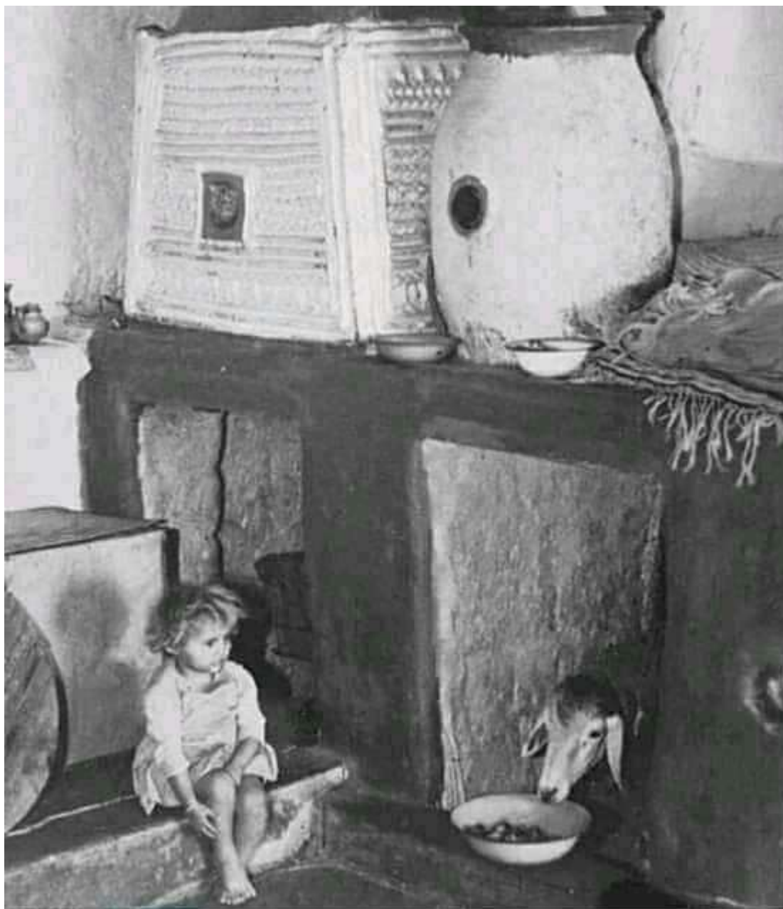
Un intérieur avec des animaux, après l'indépendance

Dans la région de Collo (voir Le Déracinement ), très affectée par la guerre, l'armée a obligé les habitants à enlever les tuiles de leurs propres maisons (photo ci-dessus n°1). Jacques Budin, un des enquêteurs sur le déracinement a été témoin de ces actes 4 . Bourdieu a pris de nombreuses photos de ces intérieurs sans toiture. Il y fait référence dans l'introduction du Sens pratique (1980, p.10). Ces destructions de coffres et de jarres à grain ( ikuffan ) l'ont