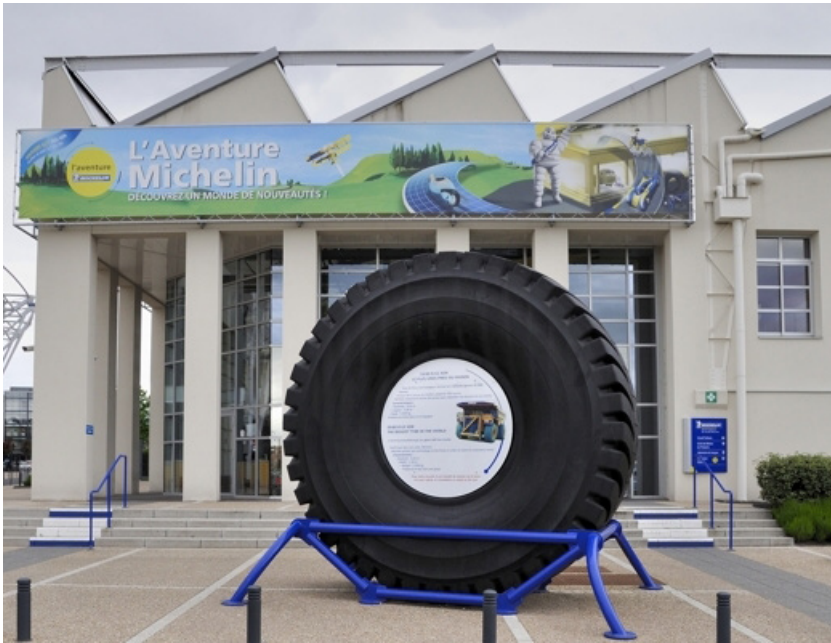
Figure 1. Entrée de l'Aventure Michelin 6

De plus, l'entreprise a une relation particulière avec le lieu de mise en scène : Clermont-Ferrand porte les signes visibles 7 de la présence de l'entreprise. Ce choix du lieu confère une résonance supplémentaire aux collections exposées, un supplément d'âme rendu vivant par le storytelling enveloppant le visiteur dans une réalité spéciale. Si les collections correspondent, selon Pomian (Gryspeerd, 2012) à des objets isolés de leur milieu naturel, séparés de leurs fonctions premières pour leur assurer avenir et pérennité, certains semblent avoir plus « de chance » que d'autres. En effet, cette préservation du lieu donne une valeur spécifique aux objets.