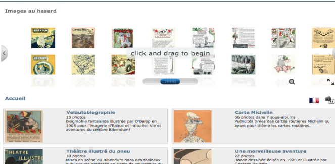
Figure 7. Le site BIBImages

et images uniques et drôles. Le site, accessible à tout le monde, expose des collections personnelles (environ 600 documents) en majorité, récupérées dans la bibliothèque familiale, sur les brocantes ainsi que grâce à des échanges réalisés sur internet ou eBay.