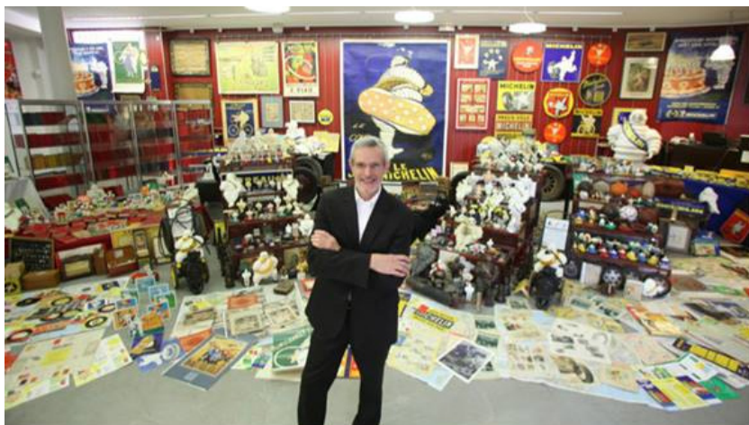
Figure 3. Convention internationale-Ventes 13