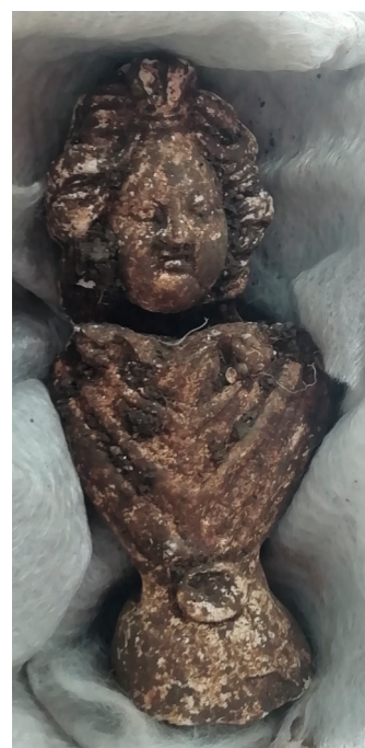
Statuette en plâtre moulée sortant de fouille, hauteur 10 cm. Sa facture tardive et sa position suggère un moulage du III e s..

Une maquette visible dans l'église de La Bâtie-Montsaléon, réalisée en 2013 par l'association « Les amis de Mons Seleucus » et l'Inrap, a tenté de faire la synthèse des connaissances sur l'époque antique. Elle sera à compléter à la lumière des nouvelles découvertes.