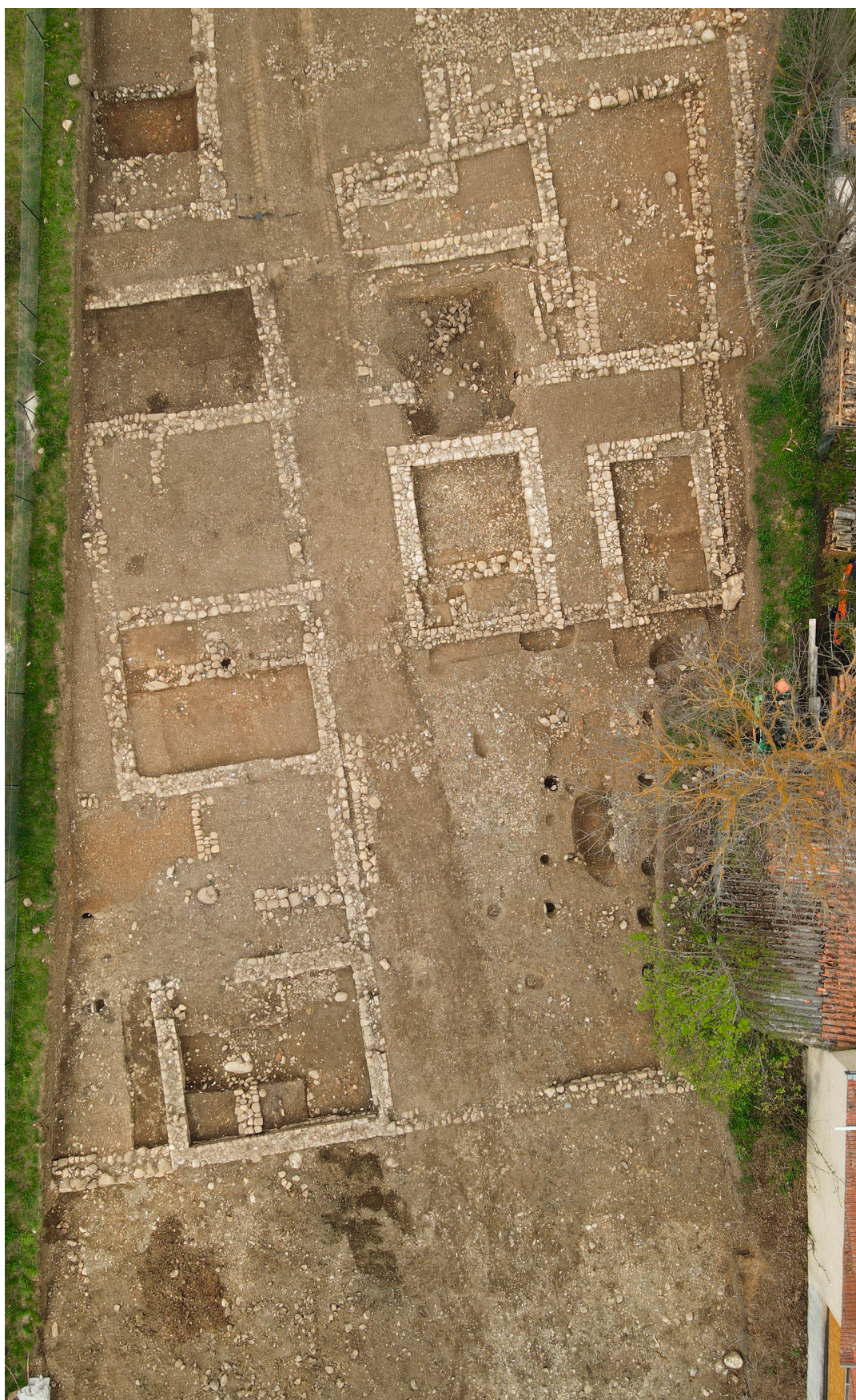
Vue aérienne du secteur du sanctuaire du III e s. Dans la cour, une grande fosse entourée de trous de poteaux a été fouillée. Elle semble en relation avec les cultes, peut-être un bûcher rituel.