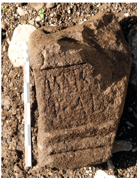
Autel aux déesses mères trouvé dans la pièce M, hauteur 60 cm.

Il reste difficile de préciser quelle divinité était adoré, sans doute plusieurs en réalité, le polythéisme païen étant bien ancré. Par contre aucune trace de pénétration du christianisme n'est décelable sur le site, d'autant moins que le jet de monnaie, tradition païenne, semble se prolonger