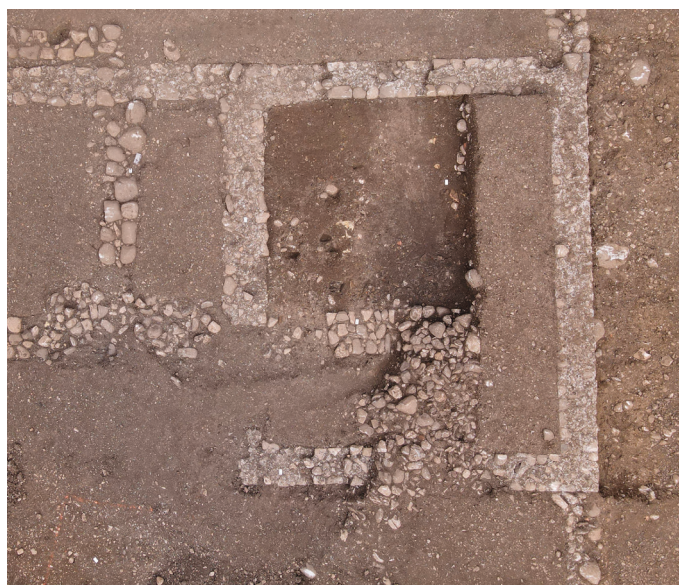
L'effondrement de murs recouvrant la zone de découverte des pièces du IV e est bien visible au bas de la photo aérienne, cl. S. Fournier.

Magnence s'est ensuite enfui à Lyon où il se suicida.