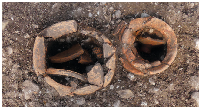
Deux vases à offrandes en place avec les couvercles tombés à l'intérieur.

Dans cette cour se trouvait également un grand foyer entouré par dix trous de poteaux qui supportaient une couverture. Il pouvait avoir une fonction de bûcher rituel vu son emplacement au centre de la cour du sanctuaire.