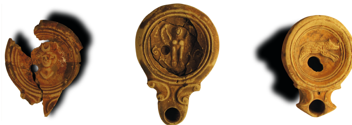
Lampes à huile provenant de la favissa. De gauche à droite : Séléne, une sphinge et un sanglier.

Le temple le plus ancien, le fanum B, construit dans la première moitié du I er s de n. è. a été modifié par la création du péribole . Sa galerie a été ensuite rapidement détruite à la fin du siècle par une grande fosse où ont été enterrés de nombreux objets de culte, sans doute pour les préserver selon un geste de respect fréquent dans l'antiquité. On a relevé dans cette fosse ( favissa ) une quarantaine de lampes à huile, des miroirs en bronze, un petit autel anépigraphique.