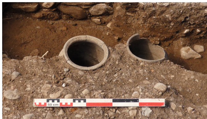
Les vases à offrandes devant le temple I en cours de fouille (cl. J. Latournerie).

Plus fascinant encore, la fouille de 2021 a mis au jour des dépôts dont la localisation ne doit rien au hasard : situées de part et d'autre de l'entrée de la cella I, deux ensembles de deux urnes (ou ollae) complètes, associées à leurs couvercles, affleuraient le sol de circulation. D'autres urnes, toujours par paire, sont réparties dans la cour (V) sur laquelle s'ouvrent les petits temples notés I et U. Leur état de conservation est remarquable et les méthodes utilisées lors de la fouille devraient permettre de comprendre, outre des monnaies, quel type d'offrandes ces contenants ont pu recueillir (vin, huile, viande, encens, etc.)