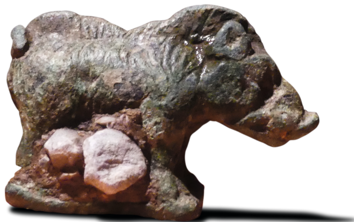
Petit ex-voto figurant un sanglier en bronze, longueur 4 cm. Photo prise juste après la mise au jour de la pièce.

peine débuté et se prolongeront jusqu'à la fin de 2022. En conséquence de quoi, le texte que vous avez sous les yeux ne donne que des résultats très préliminaires. Les photographies des objets, par exemple, sont prises juste après la fouille et avant restauration des pièces en laboratoire. Les datations restent à affiner. Il était toutefois fondamental de donner ces premières informations au public savant. Nous avons cédé à l'amicale pression de l'association Mons Seleucus pour diffuser ce premier aperçu.