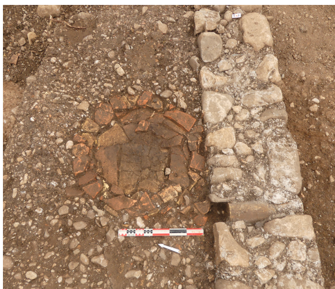
Foyer circulaire domestique (IV e s.). Notez l'évent d'aération dans le mur.

L'abandon du sanctuaire ne signifie pas un abandon concomitant du site, loin de là.