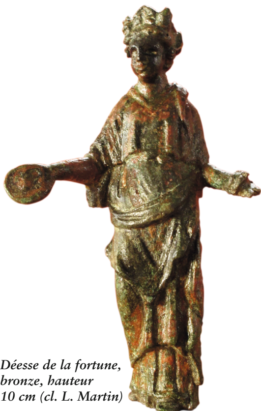
Déesse de la fortune, bronze, hauteur 10 cm

Il reste difficile de préciser quelle divinité était adoré, sans doute plusieurs en réalité, le polythéisme païen étant bien ancré. Par contre aucune trace de pénétration du christianisme n'est décelable sur le site, d'autant moins que le jet de monnaie, tradition païenne, semble se prolonger