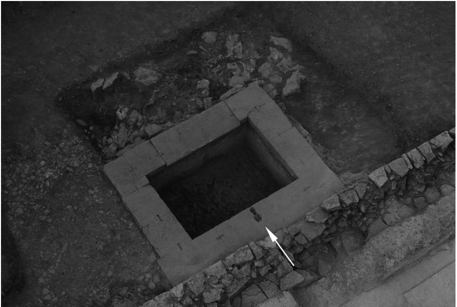
Figura 6. La fontaine, avec indication de la conduite d'alimentation.