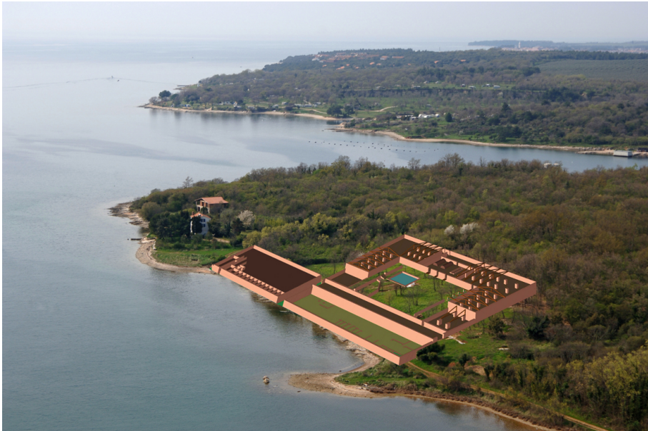
Figura 2. Planimétrie du complexe artisanal (V. Dumas, C. Taffetani / AMU–CNRS, CCJ).