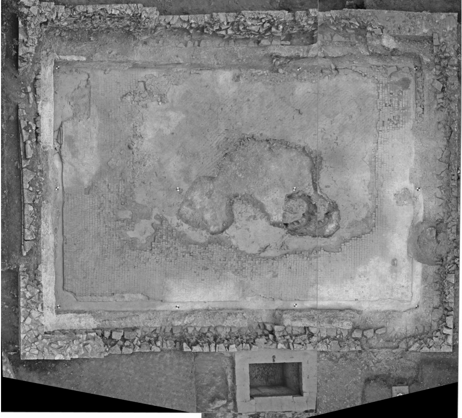
Figura 4. Photogrammétrie du réservoir et de la fontaine – Loron (C. Taffetani / AMU-CNRS, CCJ).