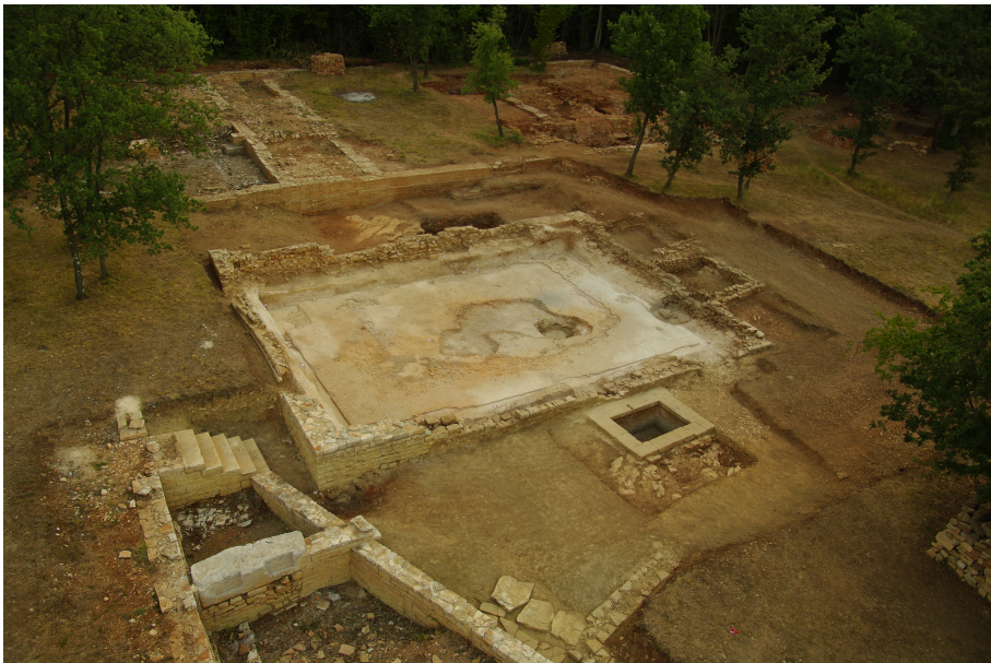
Figura 3. Angle nord-ouest de la cour de l'atelier. Vue d'ensemble du réservoir et sa fontaine.