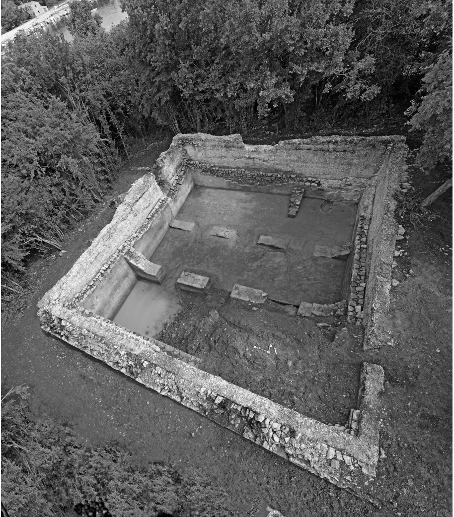
Figura 8. Vue d'ensemble de la citerne de Santa Marina.