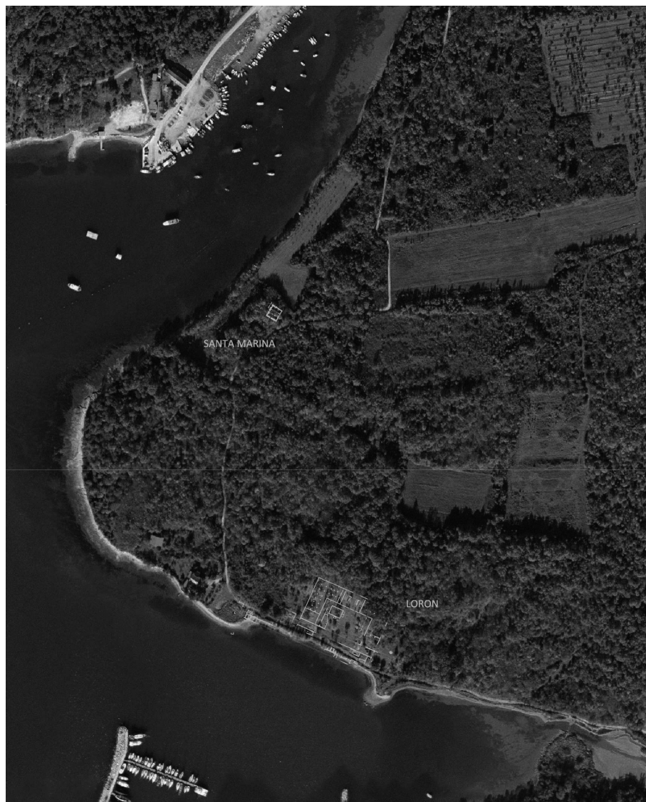
Figura 7. Localisation du secteur résidentiel de Santa Marina et du complexe artisanal de Loron sur le promontoire (C. Taffetani / AMU-CNRS, CCJ).