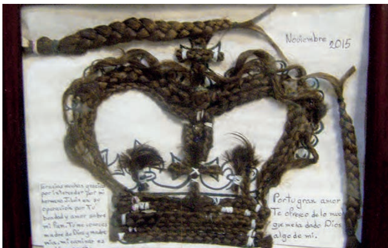
Figura 12. Don de cabello trenzado en forma de corona ofrecido a la Virgen de San Juan de los Lagos en México, y colgado en la sala de los milagros. “Por tu gran amor, te ofrezco de lo mucho que Dios me ha dado algo de mí”, dice el texto abajo a la derecha.

Figure 12. Don de cheveux tressés en forme de couronne offert à la Vierge de San Juan de los Lagos au Mexique, et accroché dans la Salle des Miracles. « Pour ton grand amour, je t'offre dans tout ce que Dieu m'a donné quelque chose de moi » dit le texte en bas à droite.