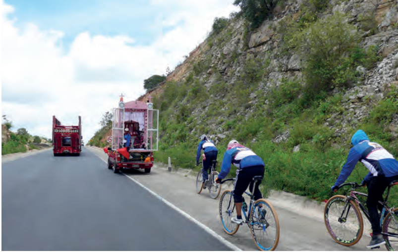
Figura 8. Peregrinación de ciclistas en el estado de Oaxaca en México siguiendo el coche que alberga la antorcha que se ofrecerá a la Virgen de Guadalupe en su basilica en la Ciudad de México.

devient une obligation communautaire et individuelle de rétribution pour la protection que ces êtres aux capacités surhumaines accordent aux croyants.