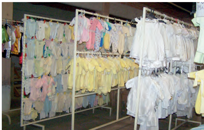
Figura 10. Venta de mamelucos depositados por las madres de niños enfermos o accidentados en la sala de los dones. San Juan de los Lagos, México.