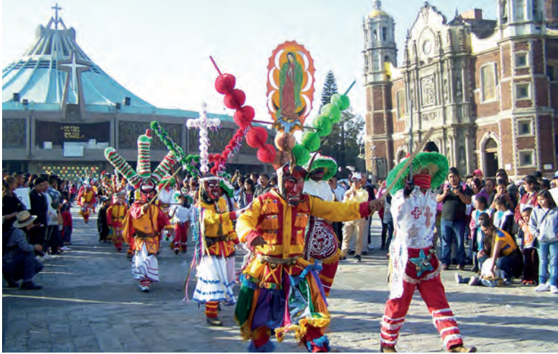
Figura 2. Danzas realizadas alrededor del 12 de diciembre durante la fiesta de la Virgen de Guadalupe alrededor de su basílica en la Ciudad de México. Grupos de danzantes vienen cada año por tradición para agradecer a la Virgen o para hacerle una petición individual y colectiva.

Figure 2. Danses réalisées aux environs du 12 décembre lors de la fête de la Vierge de Guadalupe autour de sa basilique à Mexico. Des groupes de danseurs viennent tous les ans par tradition, mais aussi pour remercier la Vierge ou lui faire une demande de manière individuelle et collective.