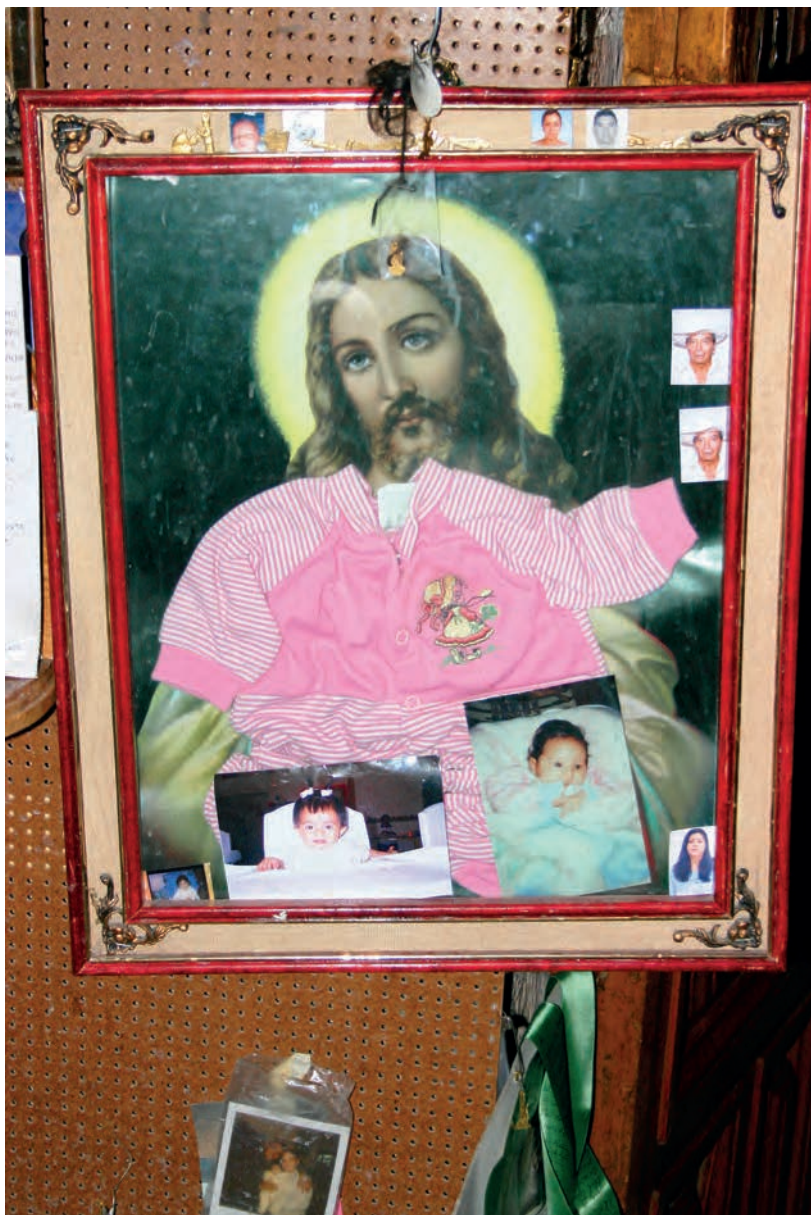
Figura 7. Exvoto de agradecimiento a la Virgen de San Juan de los Lagos, sala de exvotos de San Juan de los Lagos, México.