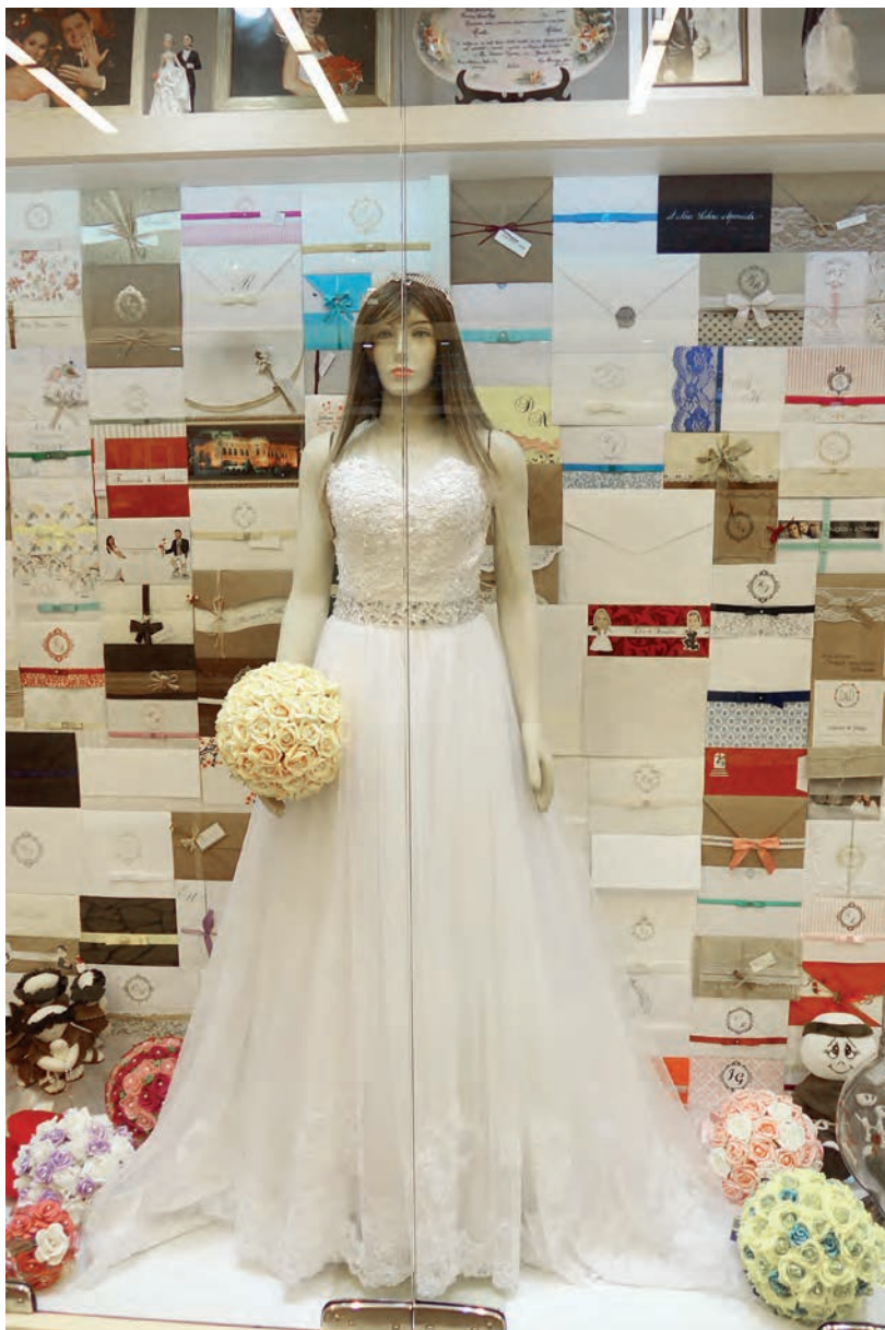
Figura 11. Vestido de novia en la sala de los milagros de Nuestra Señora de Aparecida en Brasil.