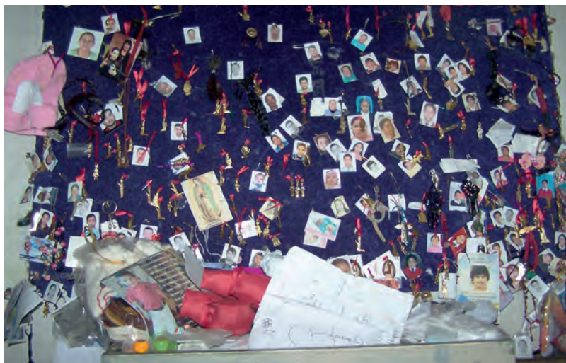
Figura 1. Fotografías, miembros anatómicos en miniatura, papeles, imágenes piadosas, accesorios para bebés ofrecidos por pedido o agradecimiento en una de las capillas ubicadas en la Basílica de la Virgen de Guadalupe en la Ciudad de México.