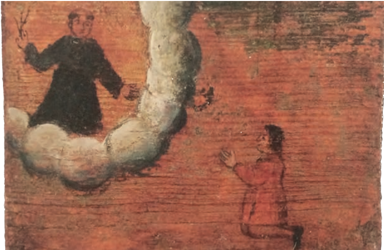
Figura 4. Tablilla pintada del siglo XV, santuario de San Nicolás de Tolentino, Las Marcas, Italia.