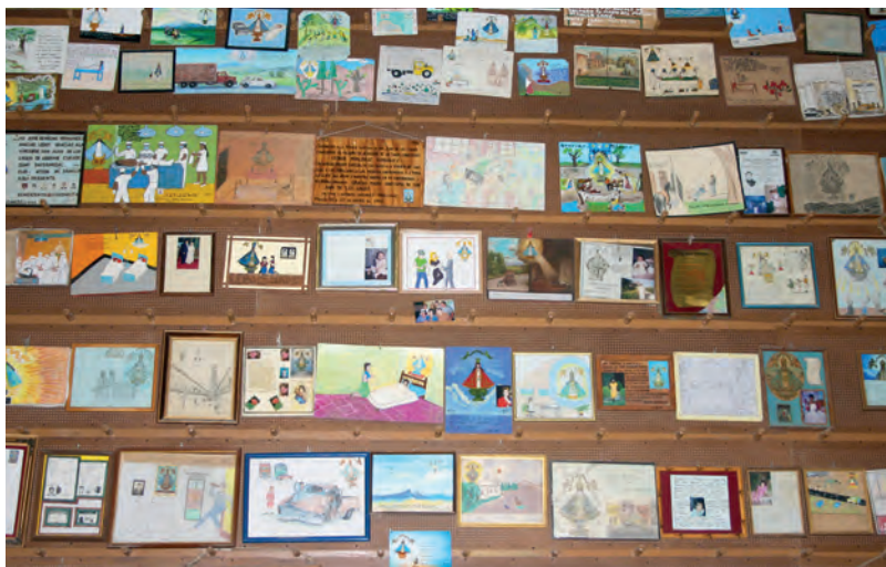
Figura 6. Sala donde están expuestos los exvotos. San Juan de los Lagos, México.

en scène du remerciement. L'ex-voto est circonscrit dans un double processus d'échange et d'énonciation, que met en œuvre son exposition, comme le remarquent Salvador Rodríguez Becerra et Francisco Luque-Romero Albornoz dans leur analyse de l'exposition des miracles par le clergé espagnol. En tant que processus d'énonciation, l'ex-voto est un témoignage (visible) de l'accomplissement d'une promesse de faveur accordée par un être surnaturel (invisible) doté de pouvoirs spéciaux. Il a une fonction communicative, qui consiste à manifester pour l'ensemble de la communauté des croyants l'accomplissement du