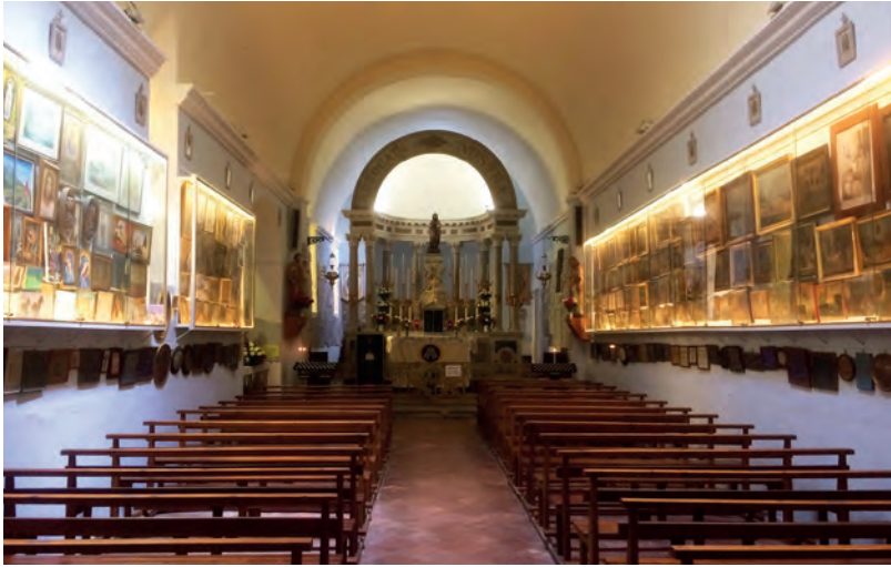
Figura 3. El interior de la Santa Casa, Loreto.