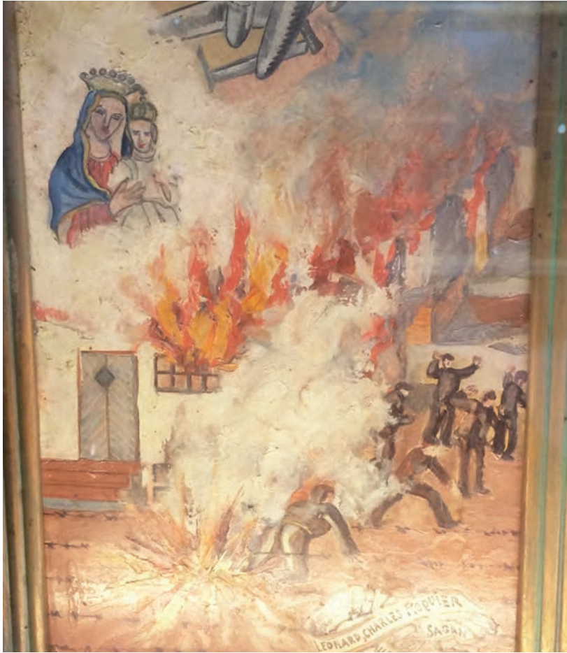
Figura 5. Pintura, santuario de Notre-Dame des Anges en el Macizo de los Maures, Provenza, Francia.