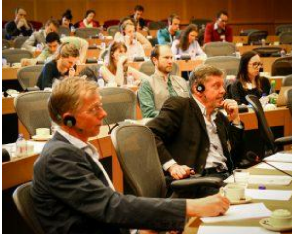
Lobbying in the EU – Greens/EFA conference 10 April 2014

Au regard de ces dynamiques, la gestion individualisée des liens et conflits d'intérêts et la réglementation qui les accompagne se situent rarement à la bonne échelle : elles privilégient l'identification de situations problématiques, ou l'existence de relations entre des experts et des intérêts privés. Une vision d'ensemble relativise l'importance des conflits d'intérêts individuels et invite à une régulation plus transversale et située à l'échelle des stratégies collectives mises en œuvre. La cartographie des activités politiques des entreprises permet de situer, mesurer la fréquence et estimer la portée des interventions nombreuses et diversifiées de l'industrie agroalimentaire. Elles relèvent de trois grands types, que nous avons qualifiés d'activités d'ordre cognitif, d'activités relationnelles et d'activités d'ordre symbolique.