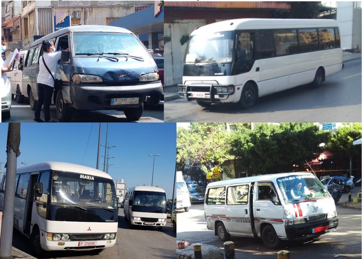
Figure 2 : des bus et des minibus de transport en commun au Liban