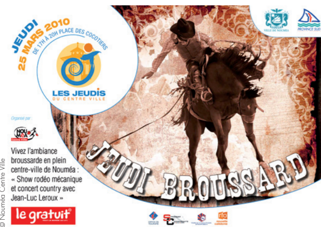
Affiche d'un Jeudi du centre-ville

Devant le dynamisme des quartiers de la Baie-des-Citrons et de l'Anse-Vata, le centre-ville fait pâle figure malgré des opérations tentant de le redynamiser, comme, sur la place des Cocotiers,