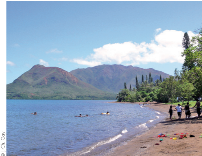
Plage Carcassonne au Mont-Dore

Des milliers de personnes, de communautés différentes, fréquentent les plages chaque fin de semaine, spécialement en saison chaude. Celle de la baie des Citrons est probablement la plus à la mode. S'y côtoient ou s'y succèdent toutes les composantes de la population. Les personnes âgées s'y rendent tôt et tous les jours, tout comme certains sportifs, n'hésitant pas à pratiquer leur activité physique (jogging,