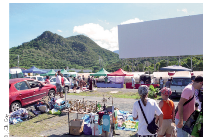
Marché aux puces du Pont-des-Français (Mont-Dore)

En fin de semaine, l'animation est polarisée par les quartiers sud. L'île aux Canards est régulièrement louée pour l'orga-