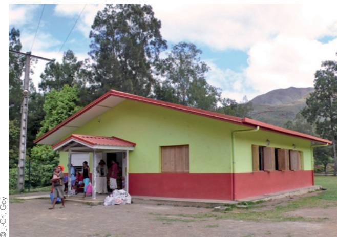
Maison de quartier de Val-Suzon (Dumbéa)

l'agglomération. Une première étape passe par l'émergence à l'échelle communale d'une centralité, mais c'est un vrai défi, en dépit d'une action volontariste qu'on remarque au Mont-Dore, avec un noyau se structurant autour de la mairie et de la poste. Pour le sud de cette commune, le centre commercial de La Coulée constitue un lieu important avec galerie commerciale et supermarché, dernière halte vers le Grand Sud, ses pique-niques et ses bivouacs, tout comme la station-service de Plum où l'on vient faire le plein des bateaux avant de partir sur le lagon. Ce rôle de porte de l'agglomération se retrouve au nord avec le péage de Koutio, lieu de rendez-vous pour ceux qui partent en Brousse ou ceux qui en