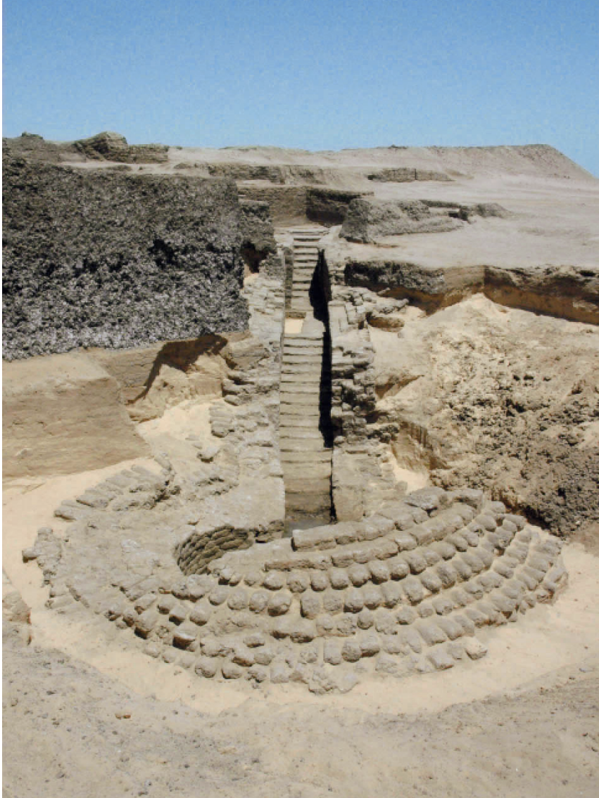
3. Construction hypogée de la première moitié du v e s. av. J.-C., angle nord-est du tell.