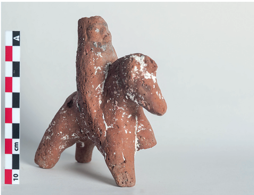
4. Cavalier perse en terre cuite.