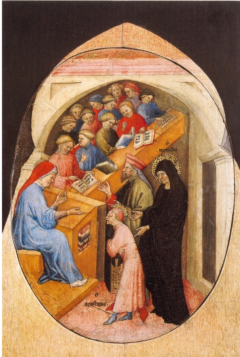
« Saint Augustin conduit à l'école par sainte Monique », Nicolò di Pietro, polyptyque de l'église saint Augustin, Pesaro, 1413-1415 (Vaticano, Pinacoteca, sala II, inv. 205)

Journée d'étude sur le programme des agrégations de Lettres classiques et de Grammaire