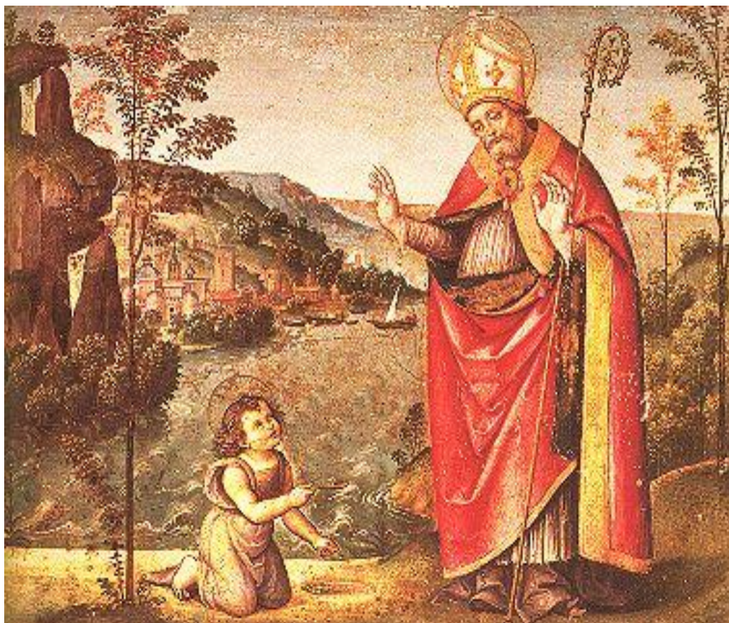
4.4. Vision de saint Augustin , Lippi Filippo (1450s-1460s) - St. Petersburg, The Hermitage