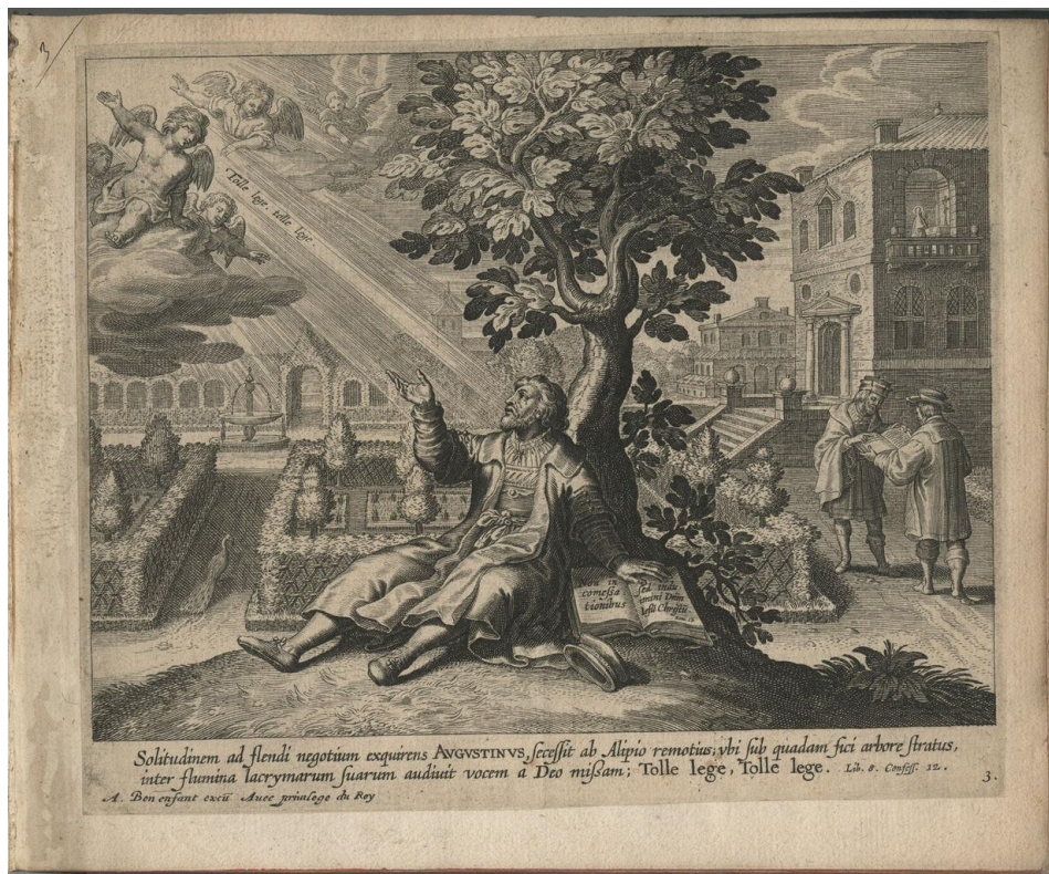
Solitūdinem ad flendi negotium exquirens AUGUSTINVS, scēssit ab Alipio remotius, ubi sub quadam figi arbore stratus, inter flumina lacrymarum suarum audiuit vocem a Deo missam; Tolle lege, Tolle lege. Lib. 8. Confess. 32.

Au premier plan, Augustin, assis sous un figuier, écoute la voix des anges qui lui disent : « Tolle, lege ! Prends, lis ! » Il est appuyé sur la Bible, ouverte au passage qui, d'après le récit des Confessions, causa sa conversion (Rm 13, 13-14). Au second plan, dans le jardin à la française, un paon, symbole de renaissance. À droite, Augustin, déjà converti, fait lire la Bible à son ami Alypius, qui se convertit à son tour. Au fond, dans le palazzo renaissance, Monique prie (Augustin attribua sa conversion à la prière incessante de sa mère).