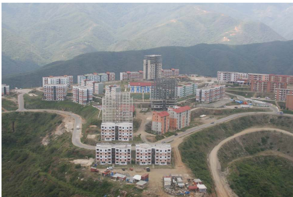
Figure . Ciudad Caribia en construction.