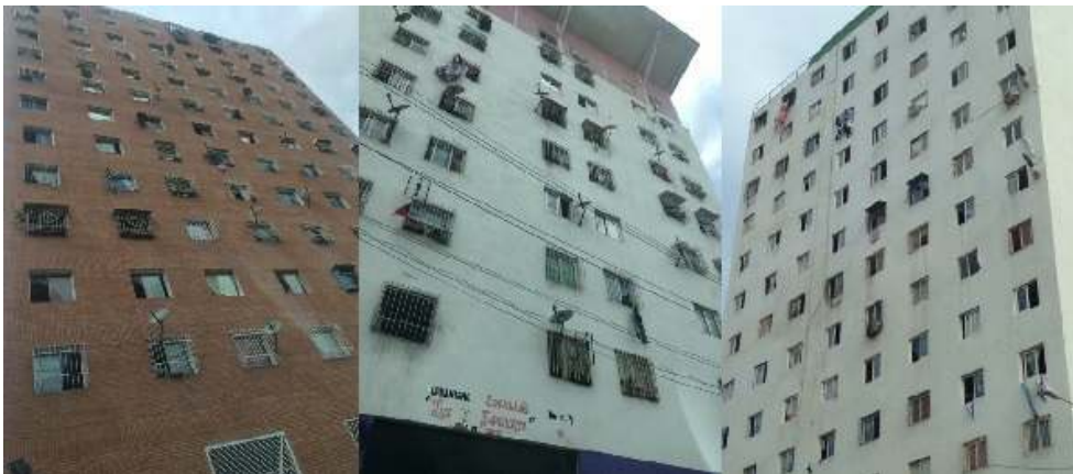
Figure . Bâtiments GMVV, construits par l'OPPPE.

La brique rouge est un matériau couramment utilisé dans l'architecture vénézuélienne à laquelle la population est habituée en termes de perception de la matière, ainsi que de sensation de chaleur propre à la terre. Elle a généralement une vitesse de détérioration plus lente que le mur peint en blanc, qui se salit dès l'achèvement des travaux.