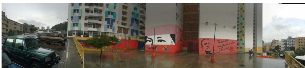
Figure . L'image symbolique créatrice d'une identité particulière : les yeux de Chavez et sa signature dans le logement social.