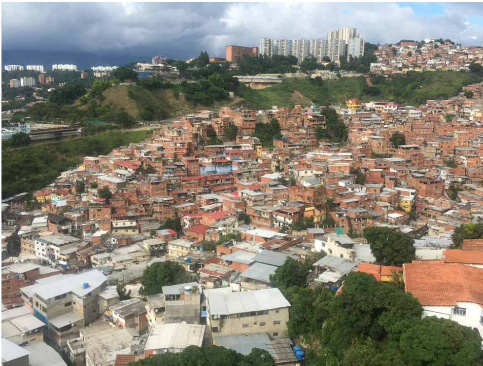
Figure . Logements informels ou « ranchos » à Caracas, barrio Santa Cruz.