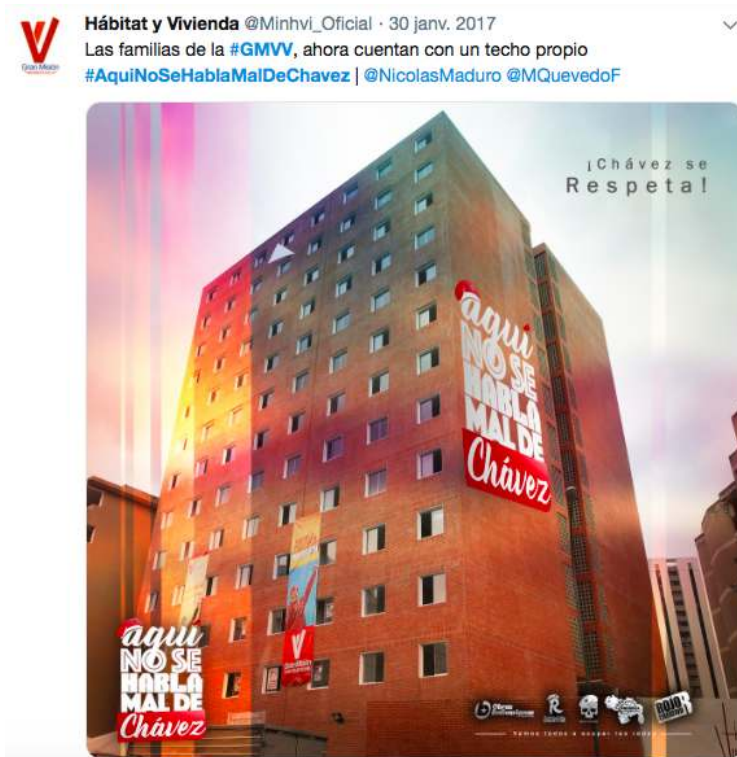
Figure . Bâtiments de la GMVV comme panneaux de propagande.