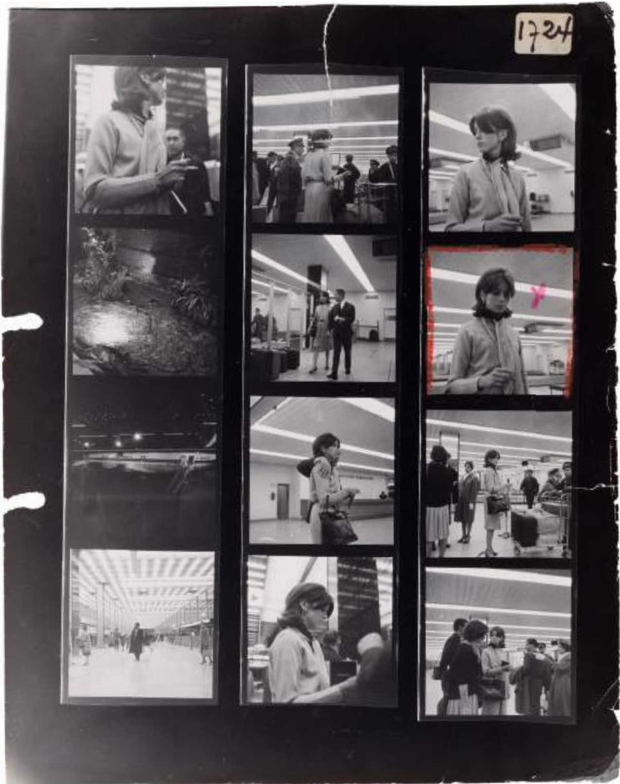
Élie Kagan Catherine Deneuve à l'aéroport d'Orly, 1961 Planche-contact argentique d'époque, 6x6, 30,4 x 24 cm