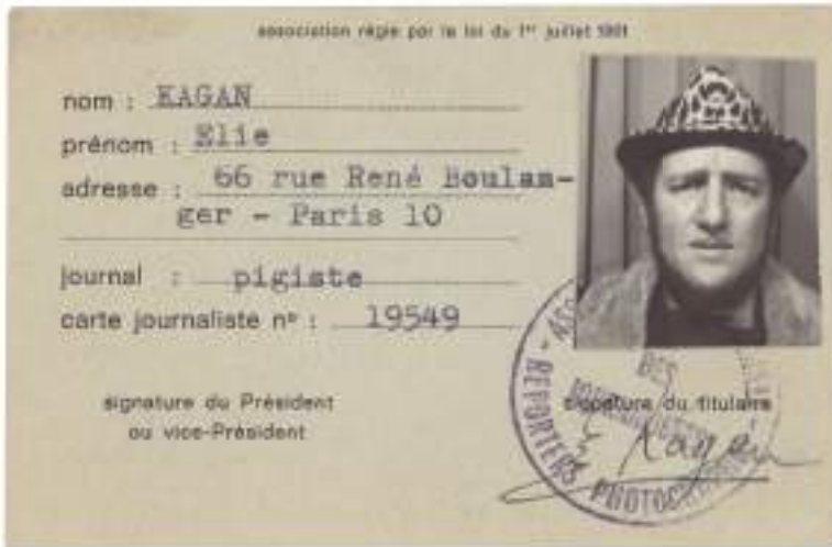
Carte de membre de la jeune Association nationale des journalistes reporters photographes (ANJRP), alors centrée sur les réseaux presse. Elle est devenue depuis l'Union des photographes professionnels.