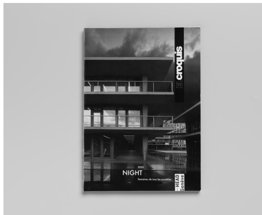
Couverture de El Croquis Nuit.

Dans la seconde moitié du XX e siècle, des auteurs tels que Reyner Banham, Venturi & Scott Brown et Rem Koolhaas ont corrigé dans une certaine mesure l'invisibilité de la nuit dans la théorie architecturale avec des ouvrages influents tels que The Architecture of the Well-Tempered Environment