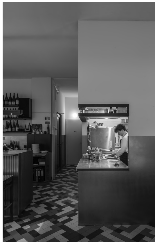
Bombar, Genève. Architectes: NOMOS Architects.

À travers la photographie, El Croquis objective, au sens littéral terme, les espaces architecturaux, notamment de l'extérieur, avec une préférence récurrente mais non exclusive pour le bâtiment isolé, qu'il s'agisse de la petite villa ou du grand bâtiment public, entouré d'arbres ou d'éléments urbains, bucoliques et fulgurants par leur présence. Il n'est pas étonnant que les maquettes d'architecture soient presque toujours peintes de l'extérieur, vue