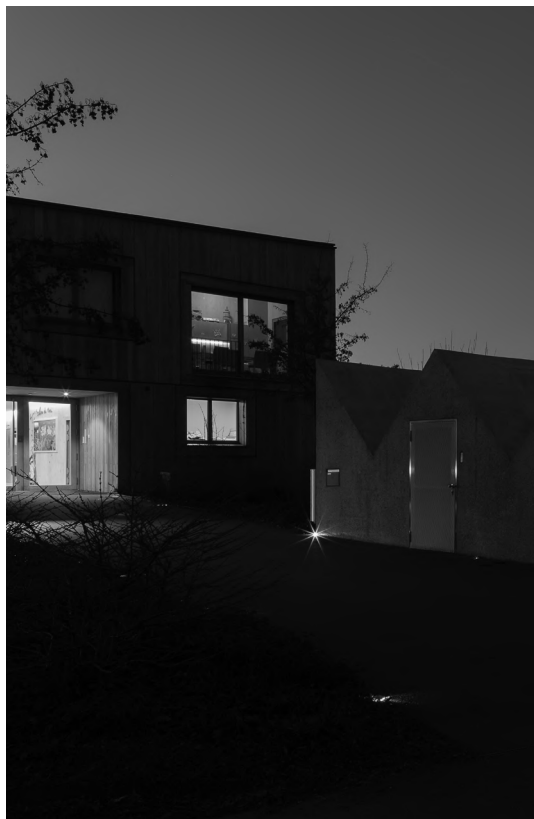
Les Couleurs du Monde, Genève, Architecture: Lacroix Chessex SA.

bâtiments, avec un maximum de trois créneaux de visites par jour. Cette planification est rarement modifiée. Peu importe l'heure bleue, l'ensoleillement, les conditions météorologiques ou la saison. Par exemple, tous les bâtiments de la monographie de José María Sánchez García (189) ont été photographiés en trois jours de soleil consécutifs en Estrémadure (Espagne), alors que ceux de l'une des monographies de SANAA - Sejima & Nishizawa (139) montrent des conditions météorologiques variables dans différents endroits du Japon, d'Europe et d'Amérique. Le point de vue, soigneusement choisi, discuté et validé par Levene et