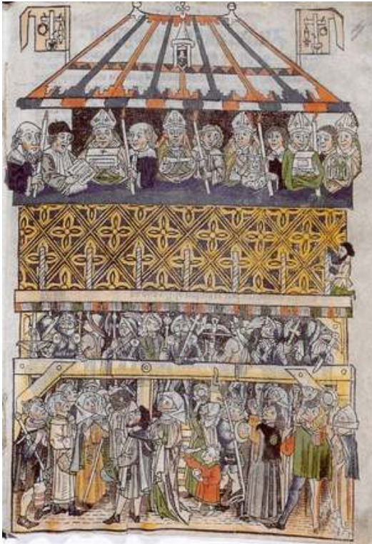
Ostension des reliques de Nuremberg à la Maison Schopperschen, 1487, gravure sur bois, Staatsarchiv de Nuremberg, Rst. Nürnberg Handschriften 399a.