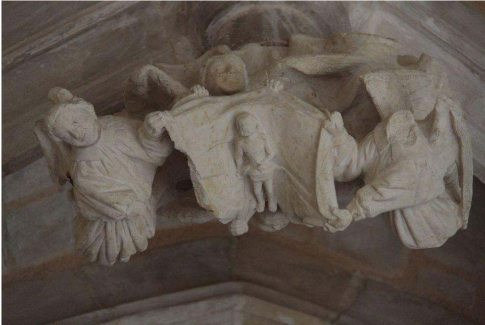
Anges portant le saint Suaire, clé du cloître de l'abbaye de Cadouin, c.1495.