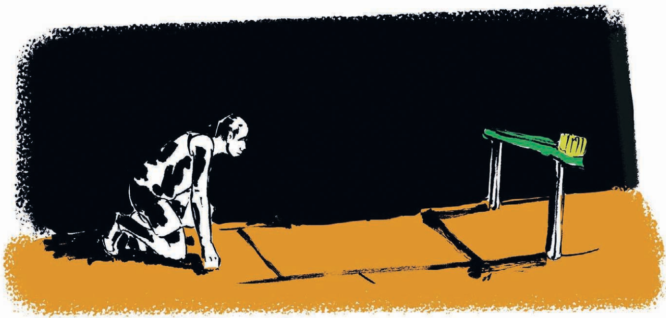
→ Exercices, Cyprien Clermontel, 2021