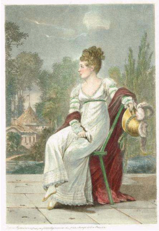
Fig. 5. Edme Quenedey des Riceys, [Portrait de Joséphine de Beauharnais au physionotrace], 1813.