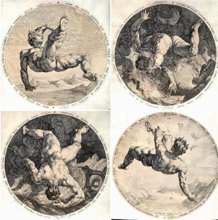
Fig. 4. Hendrick Goltzius (1558-1616) d'après Cornelis Cornelisz van Haarlem, [Les quatre disgraciés (Icare, Ixio, Tantale et Phaéton)], 1588, burin.