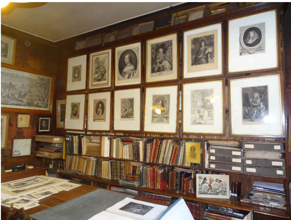
Fig. 3. Intérieur de la galerie historique, 48, rue La Fayette (Paris, 9 e arrondissement)