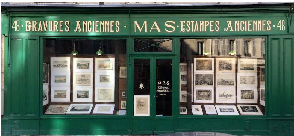
Fig. 1. Vitrine de la galerie historique MAS Estampes Anciennes, 48, rue La Fayette (Paris 9 e arrondissement), aujourd'hui transférée 33, rue Bergère (Paris, 9 e arrondissement).