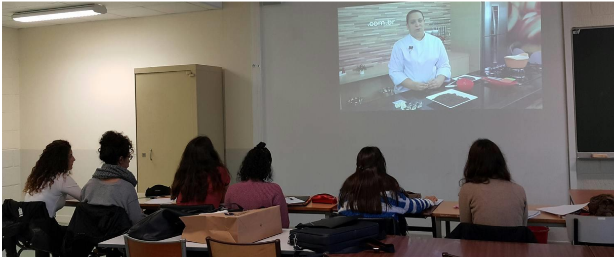
Figura 5 – Uma sala de aula de língua portuguesa

Como já disse, nesse contexto o papel do professor também muda, pois esse novo modo de funcionamento produz um novo discurso – de acompanhamento ou de orientação mais do que de transmissão de conhecimentos e de regras. O professor tem que repensar o desenvolvimento da aprendizagem.