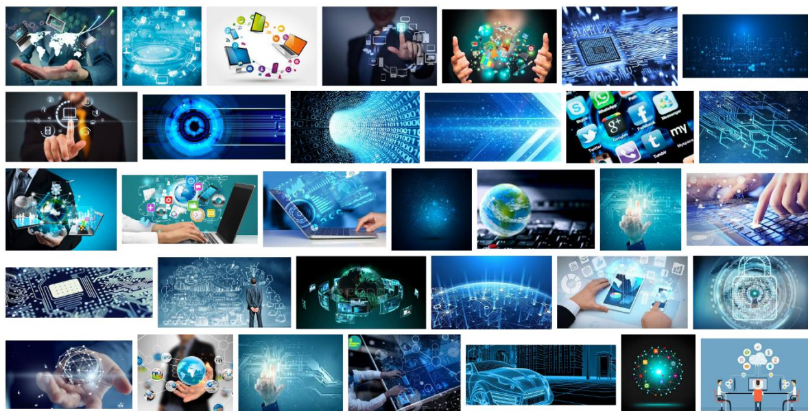
Figura 1 – Os 33 primeiros resultados da busca “tecnologia” – Google.pt (10.out.2017)

Recentemente, ao procurar na internet modelos Power Point para utilizar em uma apresentação sobre o seu uso nas aulas de Português Língua Estrangeira (PLE), fiquei surpresa com as imagens que encontrei. Essa surpresa se repetiu quando fiz uma pesquisa no Google (brasileiro e português), com a palavra “tecnologia”. Os 33 primeiros resultados que encontrei foram os seguintes: