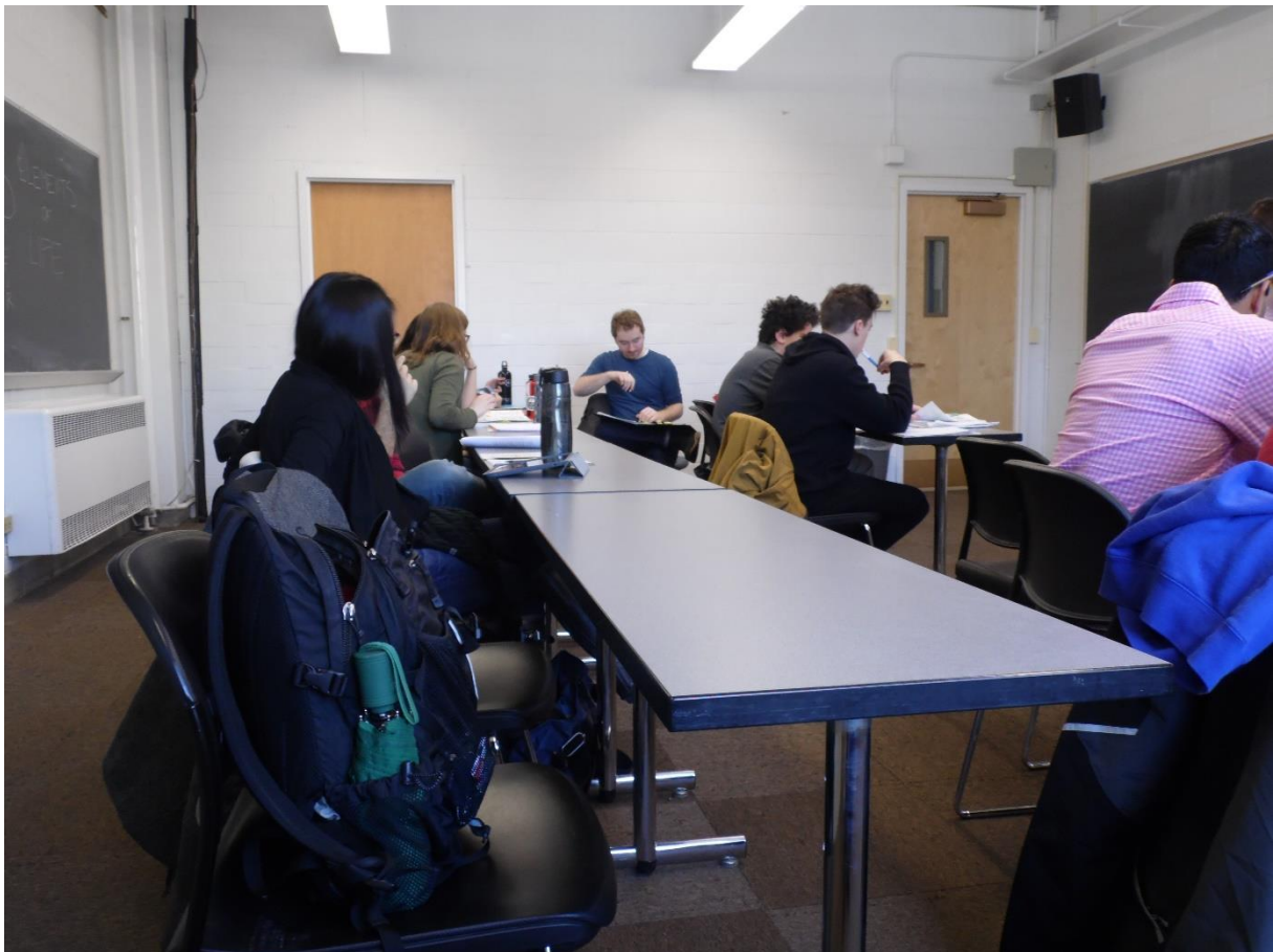
Figura 4 – Uma sala de aula de língua portuguesa

Os problemas começam quando deixamos as ferramentas digitais serem mais importantes do que o conteúdo, quer dizer, quando usamos as TIC sem mudar as nossas práticas. Como diz uma estudiosa do assunto, a estratégia de acrescentar a tecnologia às actividades já existentes na escola e nas salas de aula, sem nada alterar nas práticas habituais de ensinar, não produz bons resultados na aprendizagem dos estudantes (Miranda, 2007: 44).