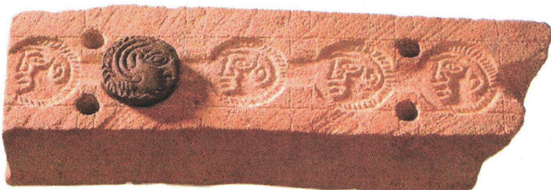
Fig. 2 : Moule à monnaie de Mleiha.

le site actuel de Thāj, dans la province d'Arabie du nord-est de l'Arabie Saoudite (Rohmer 2018).