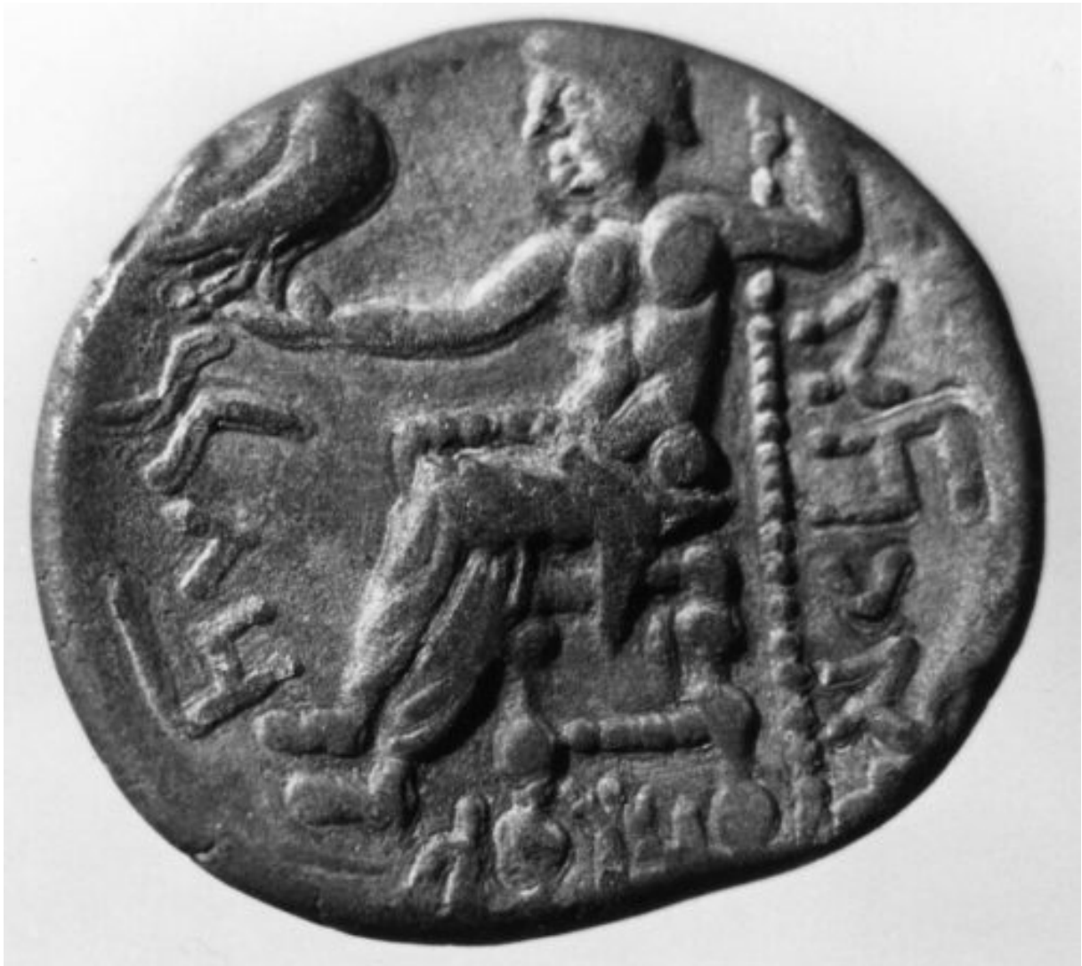
Fig. 3 : Monnaie avec le nom de la reine “Abī’el fille de Baglān” (Potts 1994).

Une autre inscription, découverte dans la région de Najrān en 2017 par la mission archéologique franco-saoudienne, laisse également penser que “Āl Omān” pourrait désigner moins un royaume qu’un groupe ethnique “clan/tribu”.