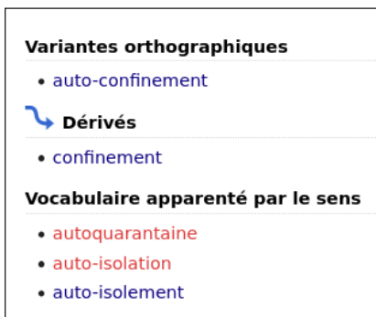
Figure 4 - Wiktionnaire : ajouts à auto-confinement du 15/09 au 20/11/2020