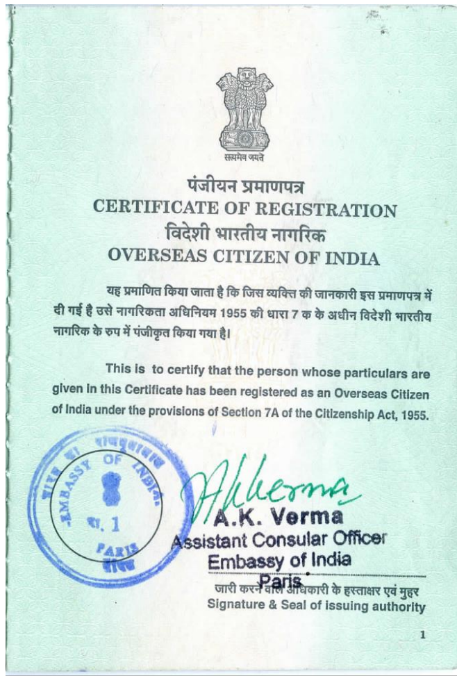
Figure 5 : Certificate of registration obtenu en 2009.

Aucun de ces groupes (race, caste, classe, religion, lieux) ne saurait constituer à lui seul mon identité. Par ailleurs, le fait d'avoir une double citoyenneté n'impose pas la prévalence d'une identité qui prendrait le pas sur toutes les autres. Au contraire, cet Overseas Citizenship of India (OCI), obtenu en 2009 grâce à mon père né à Pondichéry (fig. 5), m'a renforcée dans mon identité multiple, fragmentée, hybride, fluide, et me rassure voire me reconforte si on se réfère à « l'identité indienne » qui m'est assignée de manière récurrente, en particulier en France et beaucoup moins aux États-Unis.