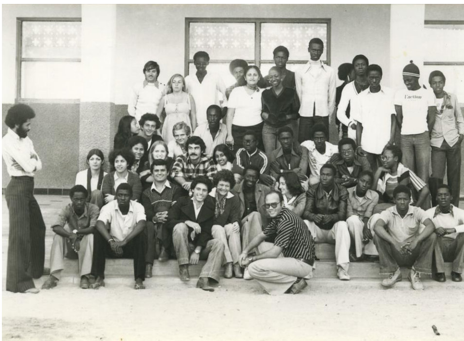
Photographie de classe de Terminale 1978, Cours Sainte-Marie de Hann (Dakar).