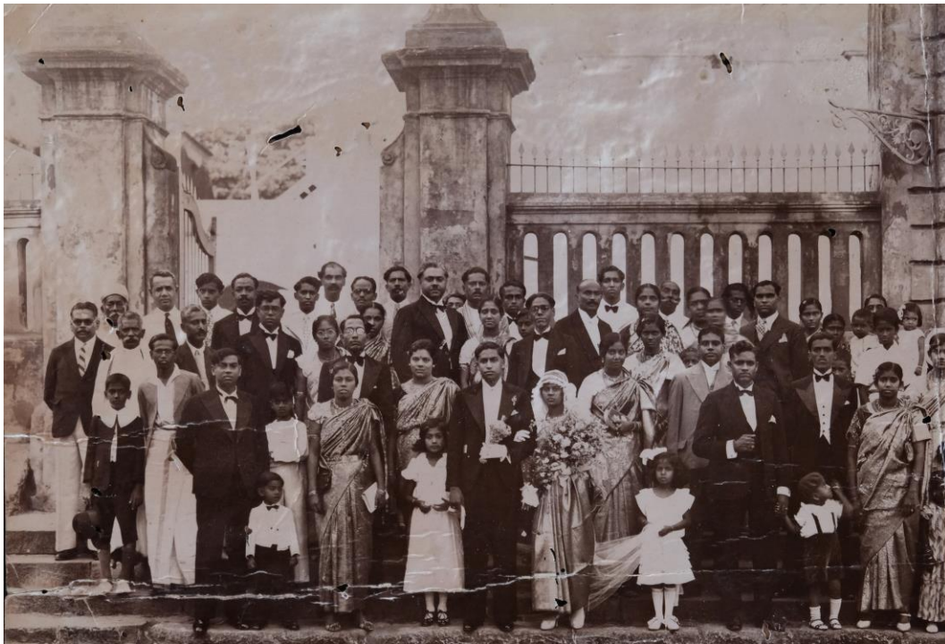
Fig. 4 Mariage d'une grand-tante paternelle en 1938 à Pondichéry.