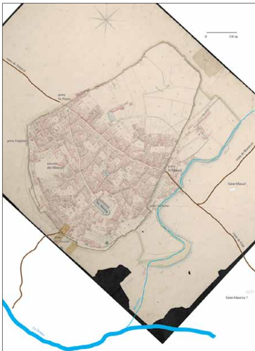
Fig. 4 – La cité de Die au XIII e siècle, sur le fond du cadastre de 1823.