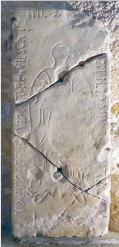
Fig. 5 – La dalle funéraire d'un prévôt de Barjols.

† c. 1542) 2 . Sous sa prévôté, la collégiale connut de nombreux travaux de reconstruction 3 .