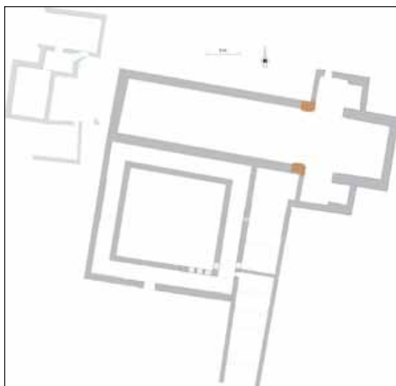
Fig. 2 – La collégiale Sainte-Marie et son environnement : restitution à l'époque romane. Le périmètre du cloître est hypothétique. © Françoise Laurier, Marc Borréani, Centre archéologique du Var et Service du patrimoine et de l'archéologie du département du Var.

semble résulter d'une campagne de construction dans la deuxième moitié du XI e siècle, puis d'une deuxième au siècle suivant (fig. 2). Elle se composait d'une nef avec transept et chevet plat, peut-être de collatéraux. Elle était flanquée au sud d'un cloître, lui-même bordé à l'est de bâtiments et pièces diverses à l'usage des chanoines, et probablement aussi sur son côté méridional. On y comptait un réfectoire au début du XIII e siècle 10 . Ce qui subsiste du cloître (trois arcades de la galerie, avec colonnettes géminées rondes et cannelées, chapiteaux corinthiens ou à croches, moulures de corniches et départs de voûte), ainsi que le tympan qui devait orner le portail occidental, indiquent d'importantes réfections de la fin du XI e siècle et du début du suivant 11 . Au XVI e siècle puis au début du XVII e siècle, l'église fut profondément remaniée, la nef et les collatéraux sont reconstruits, au sud les galeries du cloître disparurent, mais