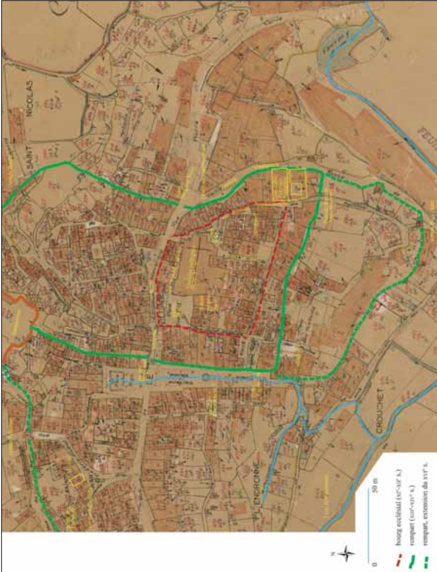
Fig. 1 – Barjols et le quartier canonial, sur le fond du cadastre du milieu du XX e siècle. © CD Var. Thierry Pécout, à l'aide des relevés de Marc Borréani et de Guillaume de Jerphanion.