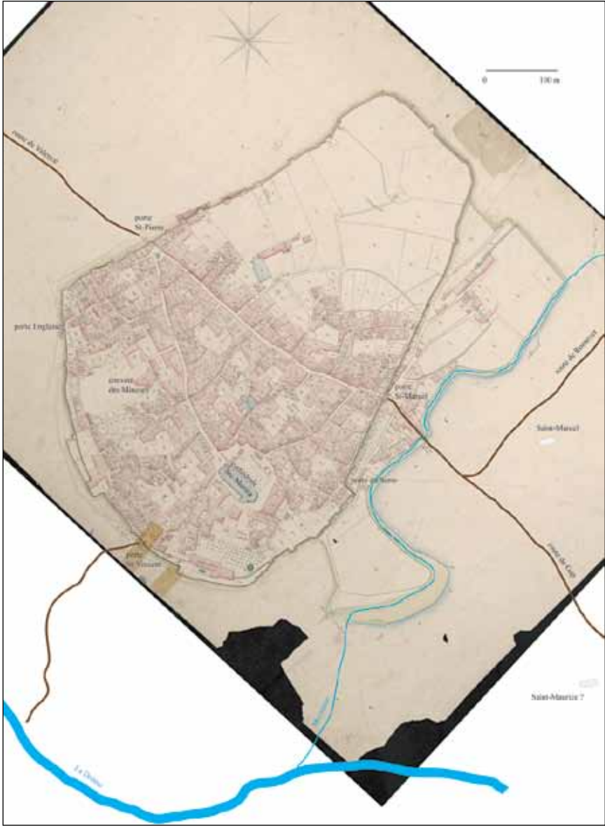
Fig. 4 – La cité de Die au XIII e siècle, sur le fond du cadastre de 1823.