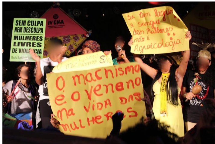
Figura 1. IVE Encontro Nacional de Agroecologia -2018.

Fonte: Post no Facebook, página MM, 20 de setembro de 2018