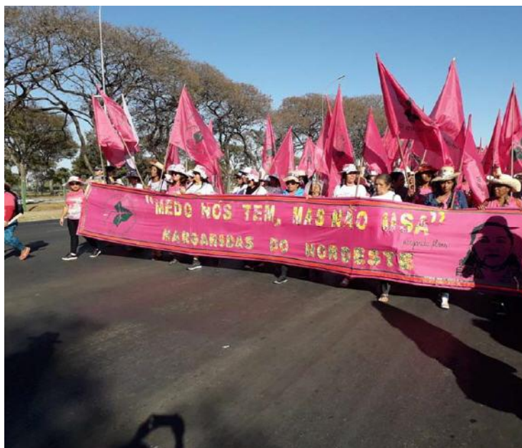
Figura 4. Bandeira MMTR-NE na MM 2019.