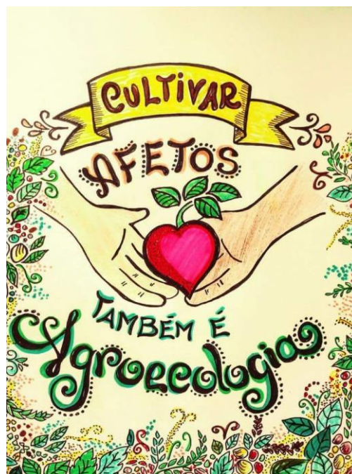
Figura 2. IV Encontro Nacional de Agroecologia, junho de 2018.

Fonte: desenho de Ricardo Wagner, oficina da mulher rural sobre a transição agroecológica