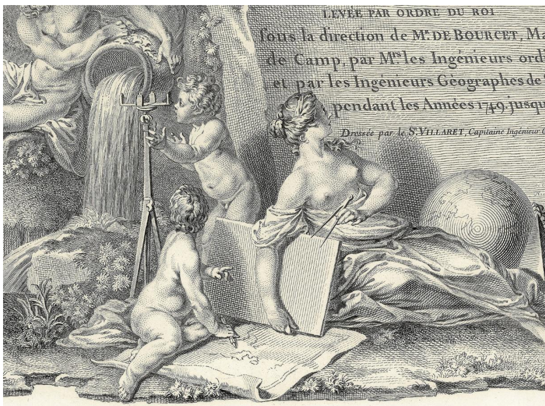
F1758/c. Instruments de relevé Extrait de la feuille de titre, s.d.

La carte du Dauphiné et du comté de Nice est considérée comme un exemple de transition quant à la figuration du relief. Elle résulte en effet d'une technique mixte qui mêle une projection plane ombrée par des hachures suivant les lignes de pente pour l'essentiel du champ représenté, avec des vues en perspective pour les sommets les plus élevés 3 . Cette combinaison est rendue possible par le choix d'un point de vue élevé pour les perspectives. Par ailleurs, le jeu des ombres donne l'impression que, malgré la perspective, il n'y a pas de versants cachés par les premiers plans 4 .