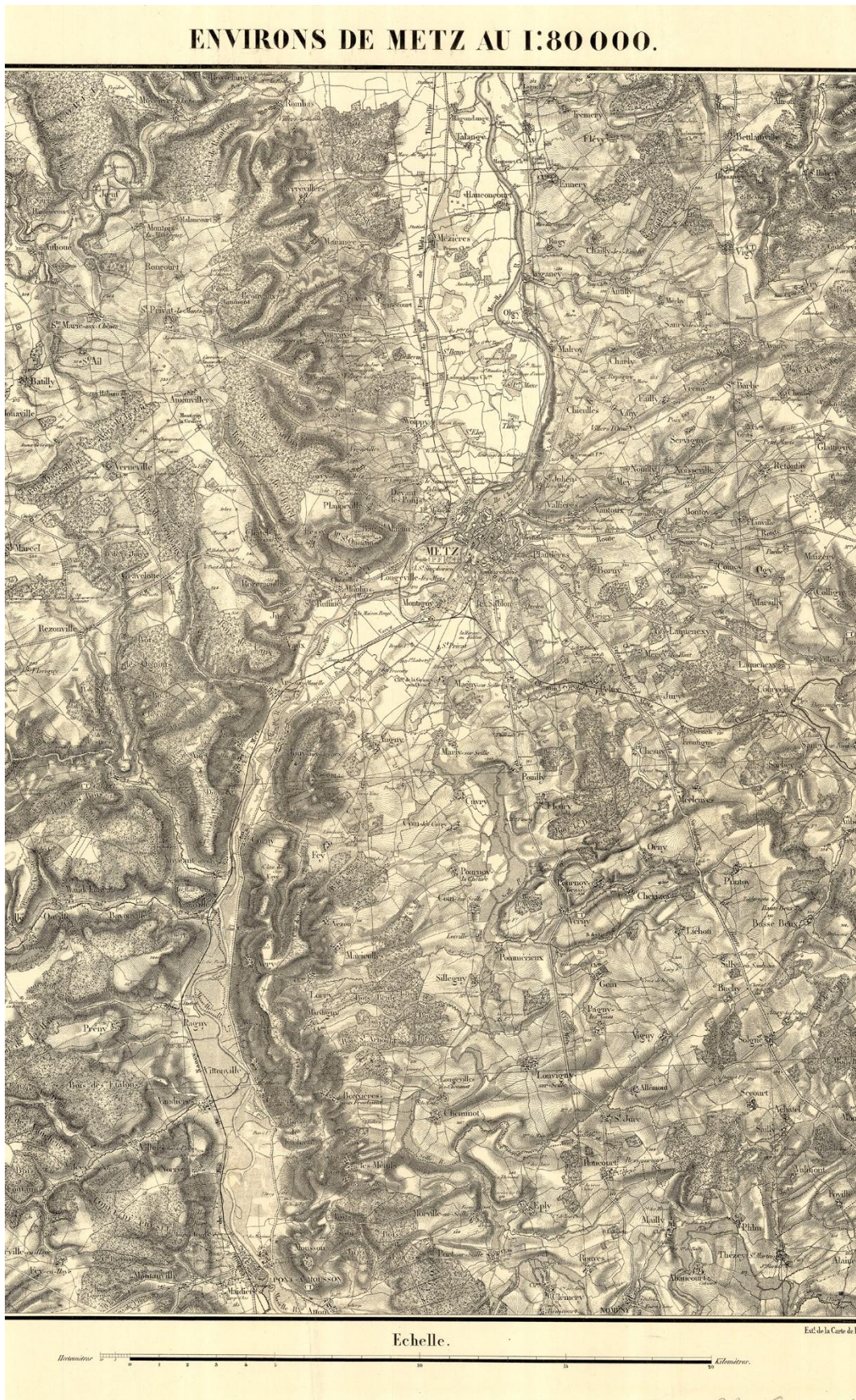
F1837/b. Environs des villes au 1:80 000, extrait exemplaire Feuille Environs de Metz au 1:80 000 , Paris, Dépôt de la guerre, tirage d'août 1877.