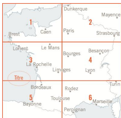
F1846/a. Ponts et chaussées, 1:500 000, 1846-1876, ministère des Travaux publics

était alors publiée 1 . Pour la planimétrie de ces régions, ils ont dû exploiter des documents plus anciens tels que la carte de Capitaine et des documents partiels dressés localement par les Ingénieurs des Ponts-et-Chaussées attachés au service des départements. Il est cependant remarquable à cet égard que la mention d'après les renseignements produits par les Ingénieurs des Ponts-et-Chaussées apparaît seulement à la troisième édition, publiée en 1861, comme si cette contribution constituait alors une nouveauté.