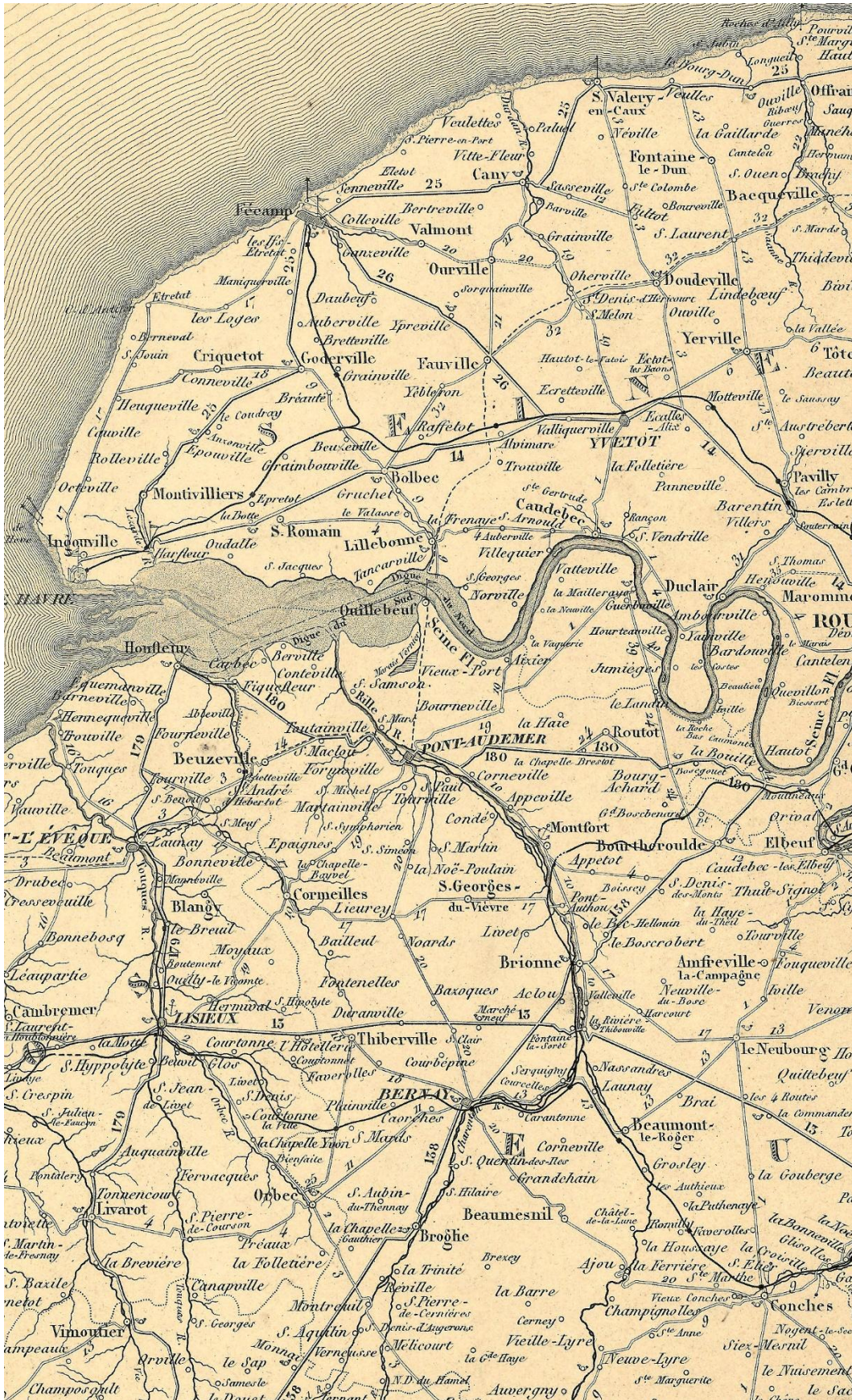
F1846/b. Carte des ponts et chaussées au 1:500 000, extrait exemplaire Extrait de la feuille n° 1, Paris, Dépôt de la Guerre, 1861.