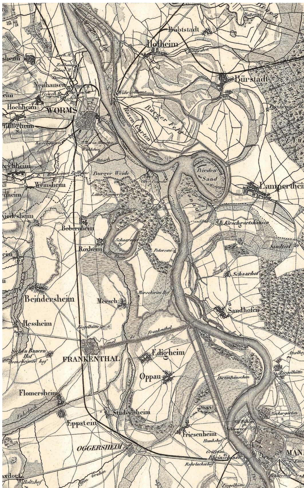
F1848/b. Les départements réunis au 1:100 000, extrait exemplaire

Une facture attentive aux particularités régionales. Dans la région de Worms, le code graphique adopté par le graveur exprime bien les multiples détours des anciens méandres du Rhin. – Extrait de la feuille n° 12 – Worms.