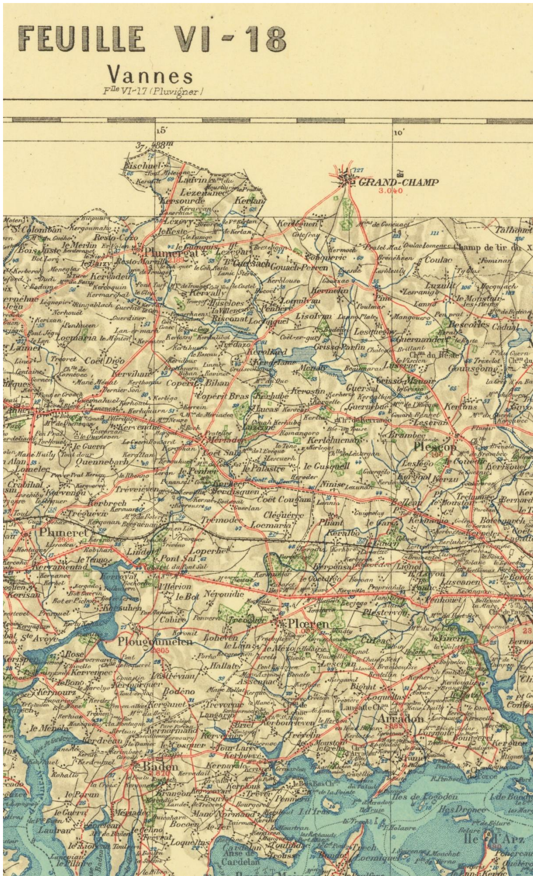
F1879/b. Carte du service vicinal au 1:100 000, extrait exemplaire Extrait de la feuille n° vi-18, Vannes, Paris, librairie Hachette, 1911.