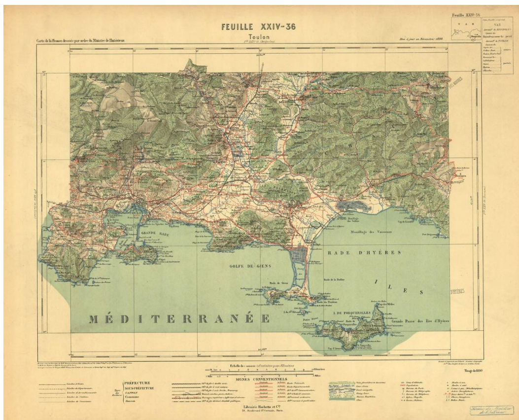
F1879/c. Carte du service vicinal au 1:100 000, feuille exemplaire

La figuration cartographique, de 28 x 40 cm, occupe moins de la moitié de la surface de chaque feuille mais cet exemple montre tout l'intérêt de la marge placée entre les deux cadres. – Feuille n° XXIV-36, Toulon , Paris, librairie Hachette, 1899, 45 x 57 cm.