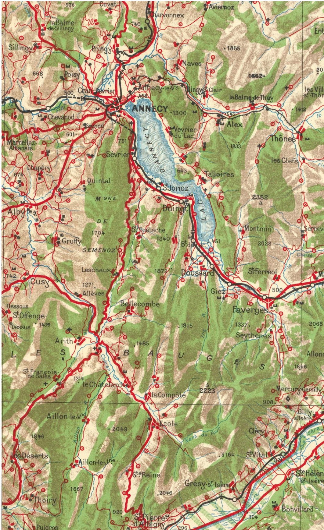
F1911_03/a. Carte aéronautique au 1:200 000, extrait exemplaire

Extrait de la feuille n° 135-186, Annecy , Aéro-club de France, 1929 [doc. université de Strasbourg].