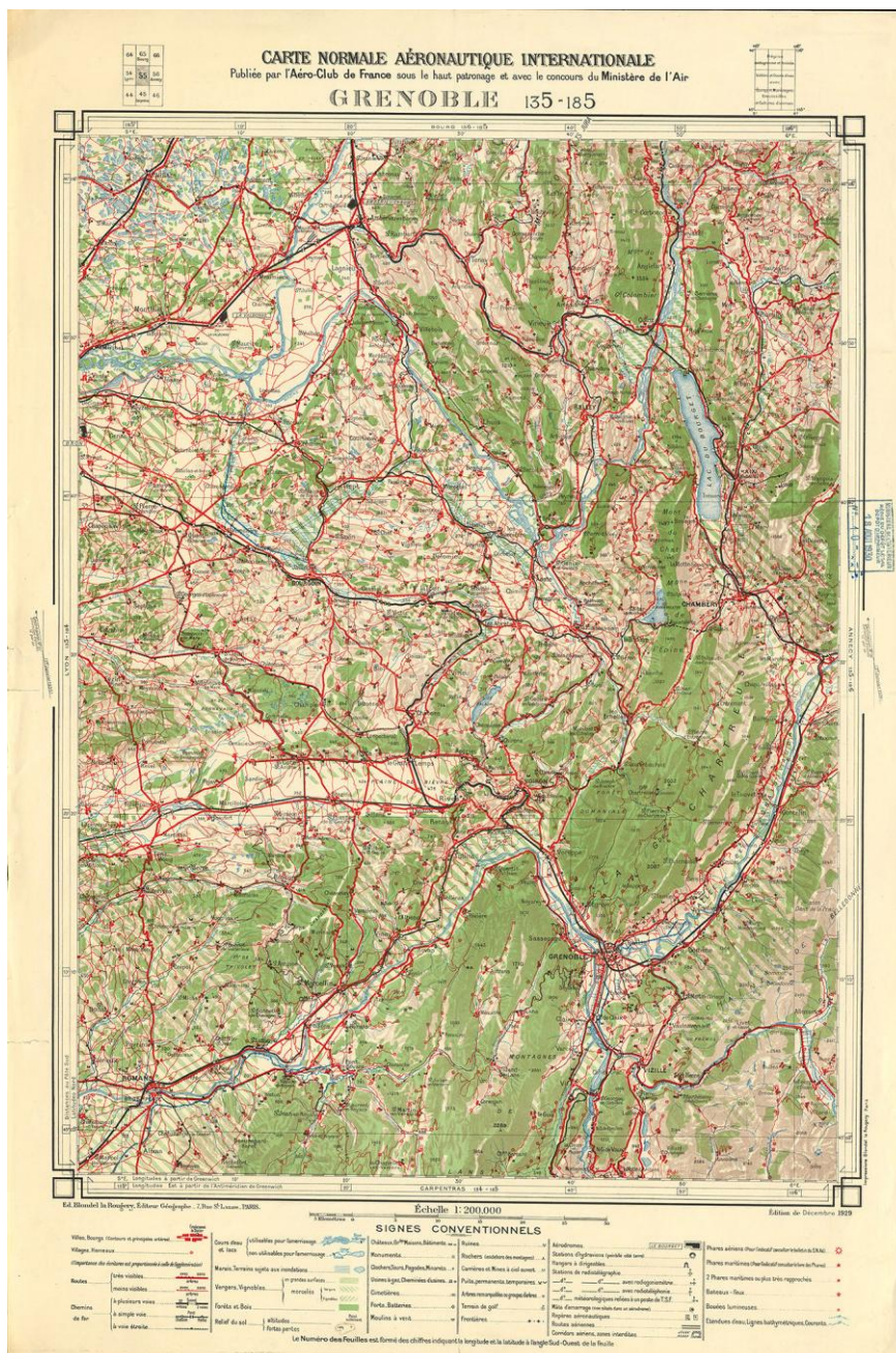
F1911_03/b. Carte aéronautique au 1:200 000, édition internationale, feuille exemplaire

Feuille n° 135-185, Grenoble , Paris, Aéro-club de France, 1929, 80 x 53 cm [doc. université de Strasbourg].