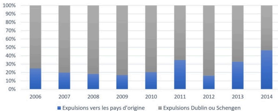
Figure 2. Les expulsions depuis Calais : des renvois avant tout en Europe ?