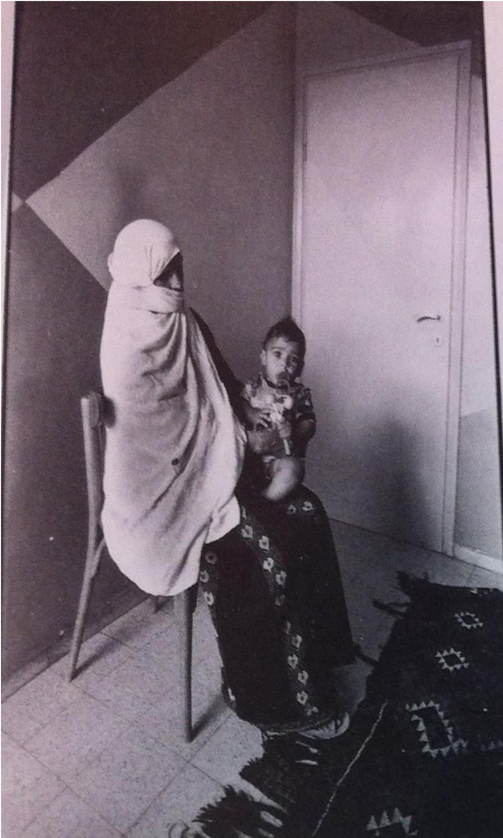
Tel Sheva, 1979. 6