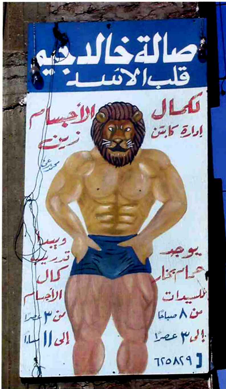
Fig. 1: salle de musculation «Khaled Gym “Cœur de lion”» (Ermant).