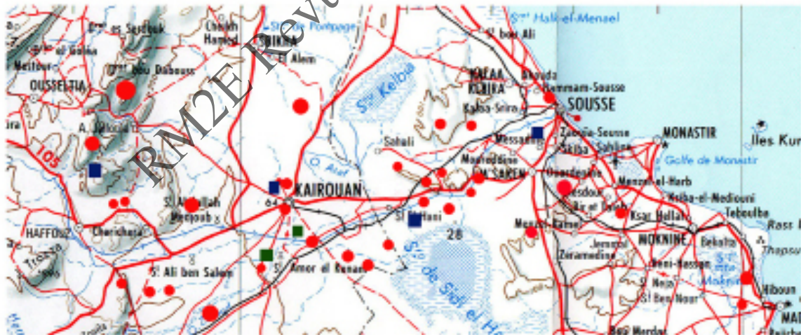
fig. 2- Localisation des ressources en eaux d'après l'étude de Marcel Solignac rouges : les bassins circulaires ou quadrangulaires et citernes urbaines non décrites ; vert : bassins de type subaériens ; bleu : bassin quadrangulaire ou citerne décrits dans l'ouvrage de Solignac. (Agnès Charpentier)

Un problème reste cependant à régler : celui de la restitution aux siècles d'Islam de ce qui leur revient. En effet, toutes les descriptions ou annotations du début du XX e siècle attribuent l'ensemble des ouvrages hydrauliques à l'Antiquité. L'étude de Solignac a démontré l'apport des dynasties aghlabides et fatimides à l'aménagement de l'alimentation en eau de l'agglomération de Kairouan et de quelques ouvrages vers Sousse et Mahdiya. Mais il ne mentionne rien sur les aqueducs de Sousse. Faut-il en conclure avec R. Gresse que puisque « les auteurs arabes ne mentionnent pas les ouvrages hydrauliques romains, cela laisse penser que ceux-ci avaient déjà plus ou moins disparus au XI e siècle ? ». Un fragment de conduit tronconique en terre cuite mis au jour