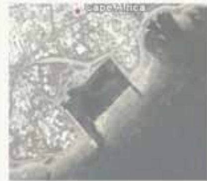
pl. I- Comparaison de la surface entre le port de Mahdiya (en bas) et celui supposé de Sousse (en haut) (Agnès Charpentier)