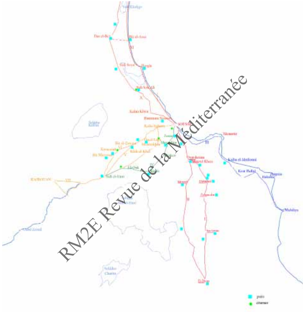
fig. 1- Itinéraires et indications des ressources en eau d'après la « description des itinéraires » SHD 1M1322 document 14 (Agnès Charpentier)