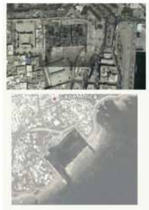
pl. I- Comparaison de la surface entre le port de Mahdiya (en bas) et celui supposé de Sousse (en haut) (Agnès Charpentier)