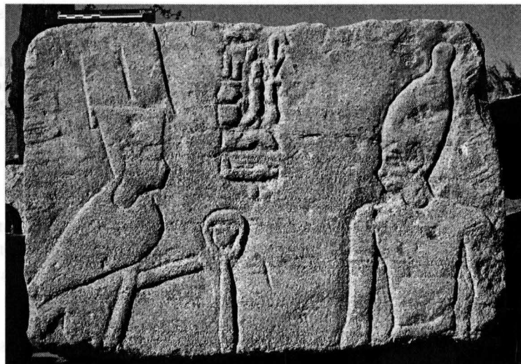
Fig. 2. Bloc T.2480 provenant des cryptes; cliché C. Thiers / Ifao.

(Tôd, n° 284); elles livrent les représentations, les noms, les dimensions et la matière de plus de 120 statues cultuelles. Un complexe de cryptes était également installé dans la partie nord du temple mais il n'est conservé qu'à l'état d'arase 12 . De nombreux blocs proviennent assurément de ces cryptes et constituent le troisième grand ensemble en cours d'étude. Les figurations qu'ils livrent ne laissent en effet guère de place au doute: telle cette représentation du roi devant une statue d'«[Amon-Rê] roi des dieux, en faïence véritable; (hauteur) une coudée» 13 (fig. 2). D'autres reliefs présentent un crocodile sur un piédestal ainsi que des dieux momiformes.