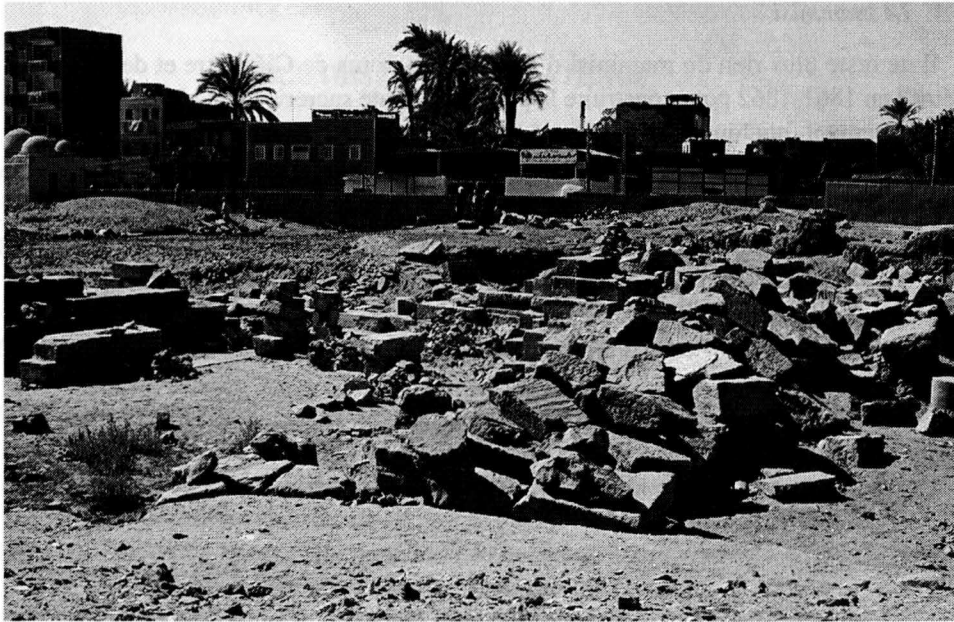
Fig. 4. Vue de la partie arrière (ouest) du temple d'Ermant; cliché C. Thiers / Ifao.

À Bab el-Maganîn, la porte d'Antonin le Pieux présentait encore ses deux montants en place à l'époque de R. Mond et O.H. Myers 29 ; un seul est encore debout aujourd'hui. Seuls quelques blocs à terre, peu accessibles, n'ont pas encore été relevés. De nombreux autres blocs gisant à proximité sont en cours d'étude et viendront compléter les premiers travaux entrepris sur cette documentation 30 .