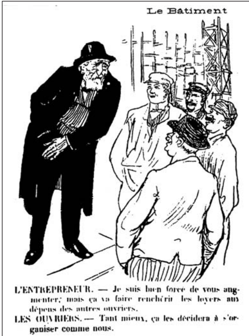
▲ ill. 13.