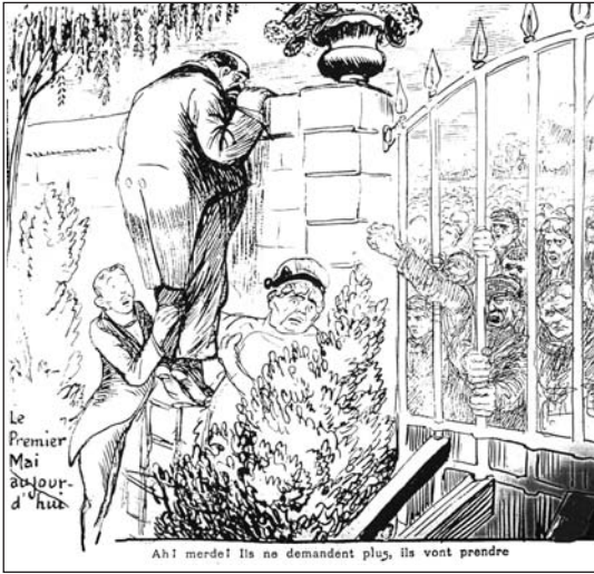
▲ ill. 6.