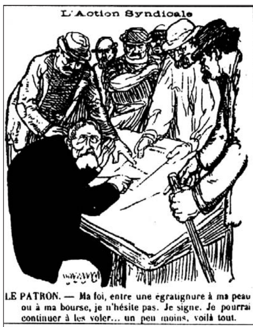
▼ ill. 12.