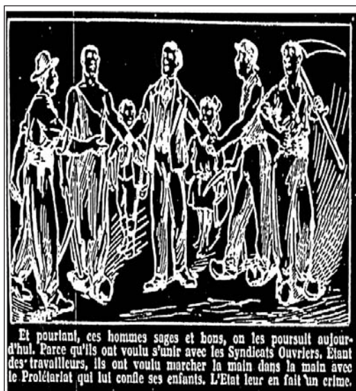
▲ ill. 11.