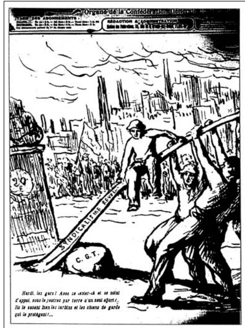
▲ ill. 14.

modèle de « L'Action syndicale » ! Le Bâtiment, qui sert classiquement de modèle de cette action avant la guerre 48 , est le lieu privilégié de ce face-à-face comme dans ce dessin du Premier Mai 1909, qui vise à montrer que l'organisation fait la force (ill. 13).