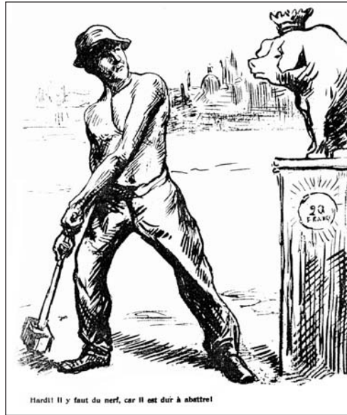
▲ ill. 2.

Les plus « réalistes » ne refusent pas les commodités de l'allégorie et de la symbolique. Entre l'ironie et l'indignation, tel auteur iconoclaste substitue le cochon au veau d'or ( ill. 2 ) 22 . Tel autre figure l'État sous les traits d'une idole monstrueuse et avide de sacrifices humains ( ill. 3 ) 23 . À l'inverse, le généreux soleil croqué par Grandjouan dans le dessin intitulé « Résultat des 8 heures », évoque, certes, la possibilité