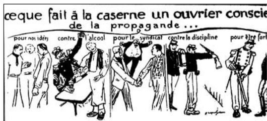
▲ ill. 10. Grandjouan, La Voix du Peuple , février 1907.

Quelques images peuvent toutefois être dégagées de ce corpus limité. D'abord les dessins tendent à montrer que le syndicat, c'est l'union des travailleurs. On le voit ainsi lors de la première apparition du syndicat dans les dessins du journal en février 1907 : c'est l'image des mains qui se serrent qui apparaît alors (ill. 10). Forme symbolique qui va traverser