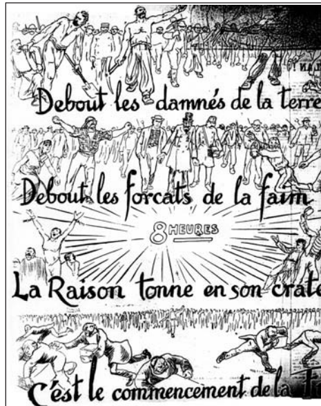
▲ ill. 9. Grandjouan, La Voix du Peuple , 1 er mai 1906.

Exploité, le peuple se définit par son appartenance au monde du travail et, au premier chef, à celui des ouvriers. Le contraire étonnerait dans cet hebdomadaire. La modernité syndicale fait bon ménage, sur ce point, avec un populisme récurrent prompt à ériger l'ouvrier en figure emblématique du peuple. Dans l'optique des dessinateurs, le prolétariat, âme du mouvement social, entraîne et libère. Les plans quasi cinématographiques de la une du Premier mai 1906 offrent une composition saisissante de cette mission émancipatrice (ill. 9). Authentifiée par les légendes, l'identité