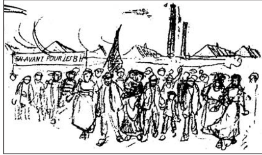
▲ ill. 8.

La Voix du Peuple mérite pleinement son nom. Alors que les textes parlent surtout des « travailleurs » et des « ouvriers », les dessins font la part belle au « peuple ». Comment désigner autrement les foules représentées à profusion ? Anonymes, les silhouettes à peine ébauchées d'hommes, de femmes, d'enfants,