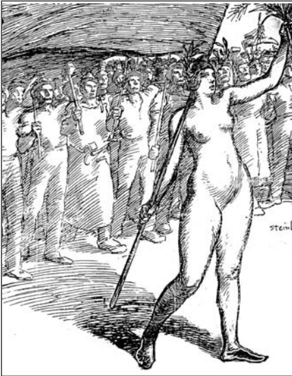
▲ ill. 1. La Voix du Peuple , 1 er mai 1901.

La décision, prise à Montpellier, de faire de l'abonnement au journal l'une des trois obligations imposées aux syndicats confédérés contribue à enrayer la chute de la diffusion 7 . Administrative, la réponse ne dispense pas d'efforts rédactionnels afin d'améliorer la lisibilité de l'organe. Les illustrations participent de cette préoccupation. Le Premier mai 1901, l'hebdomadaire rompt avec sa présentation habituelle. Le numéro s'ouvre, en pleine page, par une splendide allégorie de Steinlen que complète la légende-slogan : « En avant pour le Bien-Être et la Liberté » (ill. 1). La semaine suivante, cependant, le journal revient à l'austérité antérieure. Les articles monopolisent de nouveau les colonnes d'où les dessins semblent bannis, y compris sous forme de « cabochons ». En 1902, le retour des illustrations s'effectue à raison d'une parution concentrée sur trois numéros spéciaux annuels préparés à l'occasion des conseils de révision de l'hiver, du Premier mai et de l'appel de la classe, à l'automne.