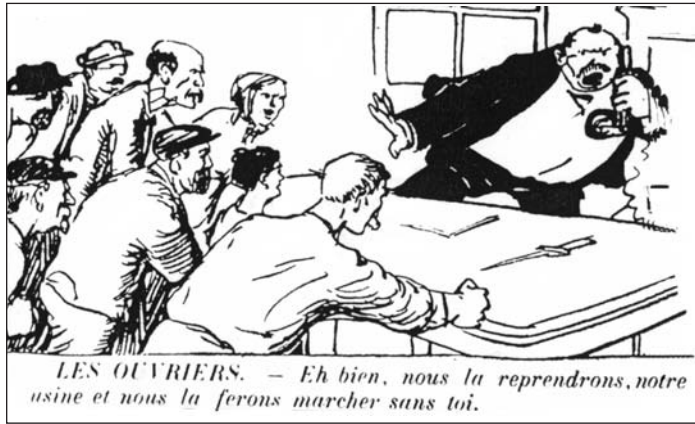
▲ ill. 5.

D'un strict point de vue revendicatif, l'iconographie du journal ne s'attarde pas sur les salaires, hormis de brèves allusions à la « thune » – 5 francs – que protège le Dieu-capital et aux 20 francs qu'exigent les cheminots 30 . La question des pensions n'est pas mieux traitée à l'exception notable d'une charge féroce contre les conditions d'accès à la « retraite des morts » 31 . Les pancartes et les calicots représentés, pour ne rien dire des légendes, insistent, en revanche, sur les huit heures dont on connaît l'importance cruciale dans la propagande et l'identité cégétistes.