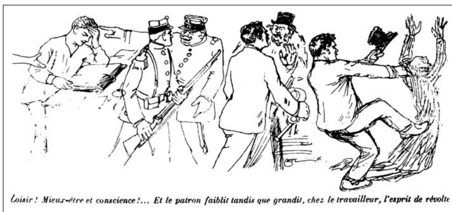
▲ ill. 4.

de quitter le travail avant la nuit, mais signale aussi l'entrée dans une ère nouvelle 24 . Ici, l'avenir radieux esquisse les contours de l'utopie. Sur un mode plus systématique, la démarche est au cœur des séries construites sur l'opposition hier, aujourd'hui/demain ou « ce qui est »/« ce qui doit être » 25 . On reste sur le même registre lorsque, classiquement, les dessinateurs donnent à voir des types de lieux, d'acteurs, d'événements imaginaires, mais cependant assimilables à des espaces, des personnages et des faits précis, concrets, vécus.