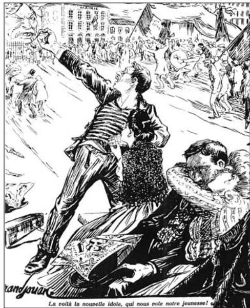
▼ ill. 3.