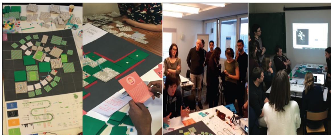
Figure 2. La production de méthodes et protocoles originaux. Atelier post-Car Ile-de-France, atelier professionnel master 2, université Paris I-Panthéon-Sorbonne, Forum des Vies mobiles, 2018.

(à la promotion pas aux commanditaires), découvrant en complément de ces compétences acquises dans la formation la mobilisation de protocoles originaux non enseignés et acquis dans la dynamique de l'atelier lui-même. L'atelier n'est pas qu'une simple séquence de mise en ordre des compétences acquises mais également une séquence de production de compétences nouvelles. Certes, là encore, cette remarque n'est guère originale, discutée depuis longtemps dans les sciences de l'éducation autour des débats sur le triangle pédagogique (apprenant, savoirs, formateurs), notamment sur le rapport entre pédagogie de l'exogène et pédagogie de l'endogène (Meirieu, 1987 31 ). Sans rentrer dans les controverses associées, il importe de signaler que ce triangle pédagogique indique que le rôle de l'enseignant est d'abord de fabriquer des situations d'apprentissage (figure 2).