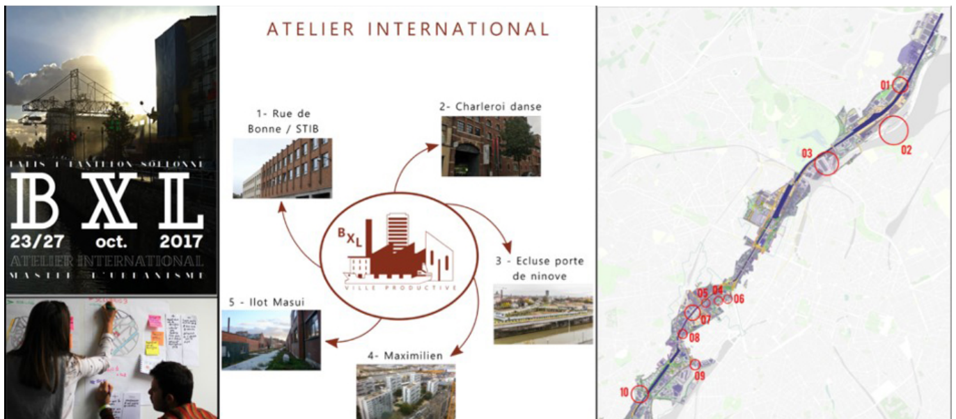
Figure 1. Le rapport au terrain dans le déroulé pédagogique. Atelier international, Bruxelles, université Paris I-Panthéon-Sorbonne, en partenariat avec Bruxelles perspective.

Le deuxième critère relève de la question du rapport au terrain et des territoires étudiés. Le corpus permet de différencier des territoires franciliens, et donc un contexte métropolitain largement étudié dans le cadre de la formation des étudiants, et des territoires non franciliens impliquant un apprentissage initial du contexte. Plus que cette connaissance ou pas du territoire, ce sont surtout les modalités du travail de terrain qu'il nous semble important de relever. Les expériences de « workshop » d'une semaine (atelier international, Bruxelles) ou le dispositif de résidences généralisé au centre Michel Serres (deux résidences par atelier, même sur des ateliers franciliens) ou encore les ateliers professionnels de master 2 impliquant des « séjours » de terrain (ateliers Rouen) indiquent l'intérêt de cette immersion dans le déroulé pédagogique, élément essentiel, par exemple, de certaines formations en architecture (deux séjours d'études réalisés dans le cadre de l'atelier professionnel mené en partenariat avec l'ENSA La Villette, séjours d'études classiques dans le module projet urbain et conception architecturale de cette école) (figure 1).