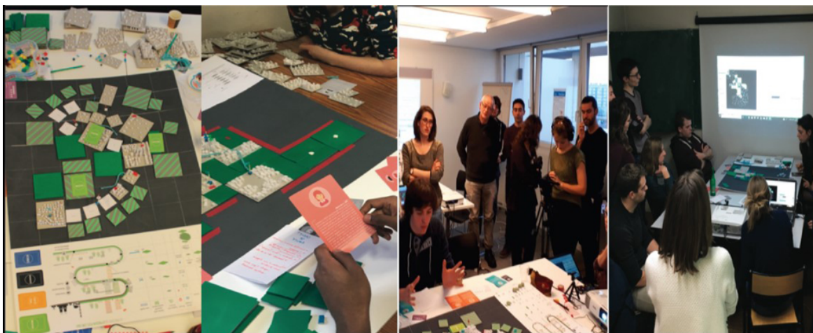
Figure 2. La production de méthodes et protocoles originaux. Atelier post-Car Ile-de-France, atelier professionnel master 2, université Paris I-Panthéon-Sorbonne, Forum des Vies mobiles, 2018.

(à la promotion pas aux commanditaires), découvrant en complément de ces compétences acquises dans la formation la mobilisation de protocoles originaux non enseignés et acquis dans la dynamique de l'atelier lui-même. L'atelier n'est pas qu'une simple séquence de mise en ordre des compétences acquises mais également une séquence de production de compétences nouvelles. Certes, là encore, cette remarque n'est guère originale, discutée depuis longtemps dans les sciences de l'éducation autour des débats sur le triangle pédagogique (apprenant, savoirs, formateurs), notamment sur le rapport entre pédagogie de l'exogène et pédagogie de l'endogène (Meirieu, 1987 31 ). Sans rentrer dans les controverses associées, il importe de signaler que ce triangle pédagogique indique que le rôle de l'enseignant est d'abord de fabriquer des situations d'apprentissage (figure 2).