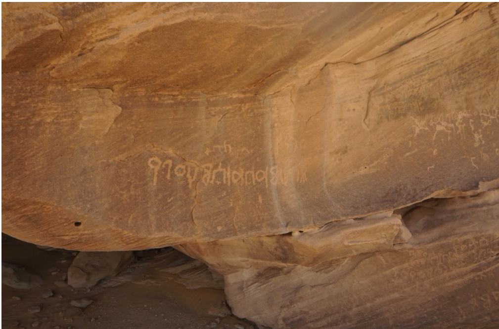
Fig. 3. Photographie de l'inscription inédite PHILBY-RYCKMANS-LIPPENS (R 1079 = SMA 10.27) (Saudi-French Archaeological Mission in Najrān, 2017).