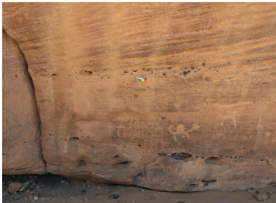
Fig. 1. L'inscription de la caravane du roi de Saba' (SMA 06.70 no. 1). (Saudi-French Archaeological Mission in Najrān, 2017)