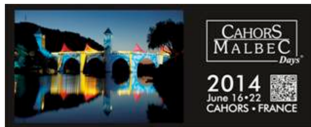
Visuel de présentation du programme des Cahors Malbec Days, 2014.

2014). Mais dans sa région d’origine, entre Bordeaux et Toulouse dans le sud-ouest de la France, le cépage malbec n’a été mis en avant sous ce nom qu’assez récemment, dans la seconde moitié des années 2000. Ce changement sémantique et stratégique en matière de communication était alors directement relié à ce qui venait de se passer de l’autre côté de l’Atlantique. L’idée était en effet de rendre visible le vin de Cahors sur les marchés internationaux en capitalisant sur le succès de l’industrie viticole argentine. À la fois originale et reflet de son temps, cette stratégie est désormais entrée dans les manuels de marketing français (Castaing, 2013 : 49-56). Elle s’est matérialisée sous de multiples formes, des étiquettes sur les bouteilles à l’ouverture d’un lieu de dégustation en ville (la Villa Cahors Malbec), en passant par l’organisation d’un événement de grande ampleur dédié au malbec, les Journées internationales du malbec, en 2008.